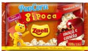
Pipoca para Micro-ondas Maçã com Canela Maiz para Microondas Manzana con Canela Microwave Popcorn - Apple With Cinnamon Flavor SAP: 100186 | 12x100g DUN 14: 1 789618390585 6 EAN 13: 7 89618390585 9 NCM: 2008.19.00