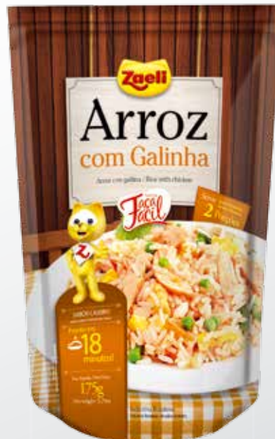
Arroz com Galinha Arroz con Galina Rice and Chicken SAP: 102443 | 12x175g DUN 14: 1 789618390915 1 EAN 13: 7 89618390915 4 NCM: 2104.20.00