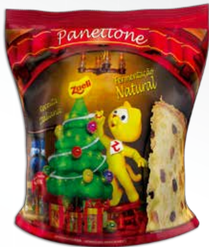
Panetone Panettone Panettone SAP: 100173 | 8x500g DUN 14: 1 789618390189 6 EAN 13: 7 89618390189 9 NCM: 1905.20.10