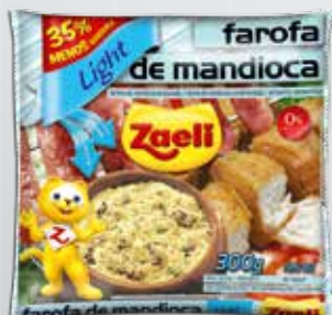
Farofa de Mandioca Light Harina de Mandioca Condimentada Light Light Seasoned Cassava Flour SAP: 100130 | 12x300g DUN 14: 1 789618390480 4 EAN 13: 7 89618390480 7 NCM: 1106.20.00