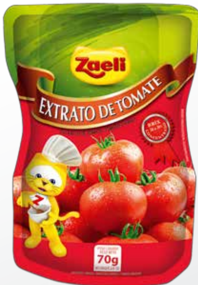
Extrato de Tomate Extracto de Tomate Tomato Extract SAP: 102699 | 100x70g DUN 14: 1 789618390942 7 SAP: 102965 | 25x70g DUN 14: 2 789618390942 4 EAN 13: 7 89618390942 0 NCM: 2002.90.90

Combine sua criatividade na cozinha com o novo Extrato de Tomate Zaeli, deixando seus pratos ainda mais gostosos.