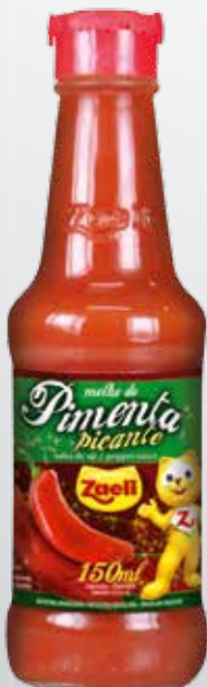
Molho de Pimenta Picante Salsa de Pimenta Roja Hot Pepper Sauce

SAP: 100876 | 12x180g DUN 14: 1 789618390424 8 EAN 13: 7 89618390424 1 NCM: 2103.30.21