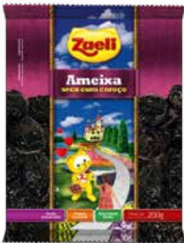
Ameixa Seca com Carozo Ciruela Seca con Carozo Dry Plum whit Lump SAP: 101405 | 12x200g DUN 14: 1 789618390820 8 EAN 13: 789618390820 1 NCM: 0813.20.10