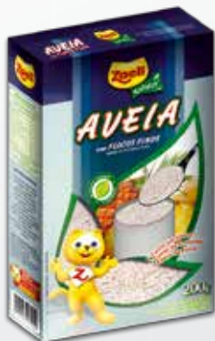
Aveia em Flocos Finos Avena en Escamas Finos Fine Oat Flakes SAP: 101377 | 10x200g DUN 14: 1 789618390720 1 EAN 13: 7 89618390720 4 NCM: 1104.12.00