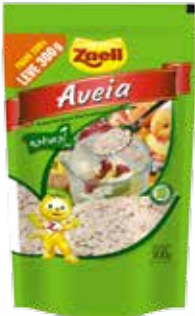
Aveia em Flocos Grossos Avena en Escamas Gruesa Coarse Oat Flakes SAP: 102967 | 12x300g DUN 14: 1 7896183 91009 6 EAN 13: 7 896183 91009 9 NCM: 1104.12.00