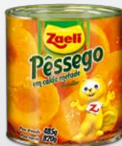
Pêssego em Calda Duraznos en Calda Dipped Peaches SAP: 100183 | 12x485g DUN 14: 1 789618390068 4 EAN 13: 7 89618390068 7 NCM: 2008.70.10