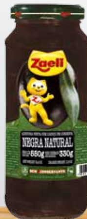
Azeitona Negra Natural Aceituna Negra Natural Natural Black Olives SAP: 101005 | 12x330g DUN 14: 1 7896183 90768 3 EAN 13: 7 896183 90768 6 NCM: 2005.70.00