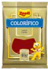
Colorífico | Colorado | Annatto SAP: 100082 | 20x40g DUN 14: 1 789618390101 8 EAN 13: 7 89618390101 1 SAP: 100081 | 10x500g DUN 14: 1 789618390168 1 EAN 13: 7 89618390168 4 NCM: 2103.90.21