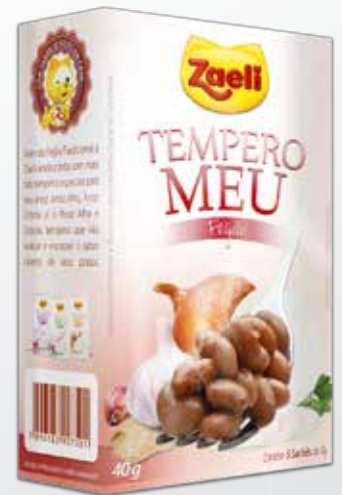
Tempero Meu Sabor Feijão Tempero Mi Poroto My Seasoning Bean SAP: 101130 | 24x40g DUN 14: 1 789618390750 8 EAN 13: 7 89618390750 1 NCM: 2103.90.21