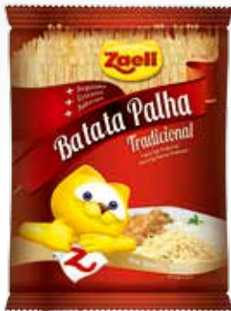
Batata Palha Tradicional Patata Paja Tradicional Traditional Straw Potato SAP: 101155 | 24x80g DUN 14: 1 789618390732 4 EAN 13: 7 89618390732 7 NCM: 2005.20.00