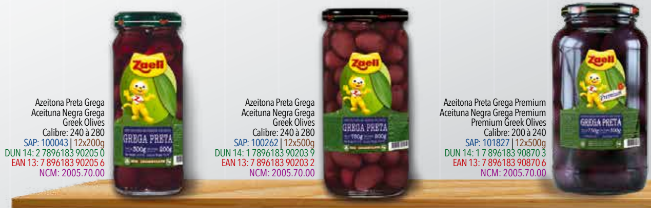
Azeitona Preta Grega Aceituna Negra Grega Greek Olives Calibre: 240 à 280 SAP: 100043 | 12x200g DUN 14: 2 7896183 90205 0 EAN 13: 7 896183 90205 6 NCM: 2005.70.00