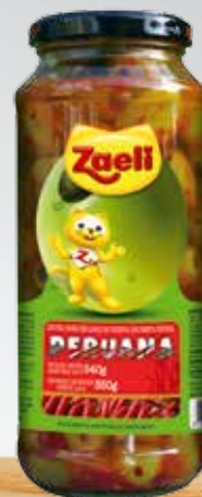
Azeitona Verde sem Caroço Peruana Aceituna Verde Sin Caroço Peruana Pitted Olives Peruana SAP: 102744 | 12x350g DUN 14: 1 7896183 90963 2 EAN 13: 7 896183 90963 5 NCM: 2005.70.00