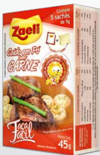
Caldo em Pó Sabor Carne Caldo en Polvo Sabor Carne Powder Seasoning Flavor Beef SAP: 100469 | 24x45g DUN 14: 1 789618390644 0 EAN 13: 7 89618390644 3 NCM: 2103.90.21

O Caldo em Pó Zaeli substitui os caldos em cubos tradicionais e pode ser utilizado para o preparo de alimentos ou pratos prontos, como arroz, feijão, ensopados, molhos e risotos. Também dispensa o uso de outros temperos adicionais porque foi desenvolvido a partir de uma combinação especial de temperos que acentuam o sabor e aroma às refeições. Sabores: Carne, Galinha, Legumes e Costela.