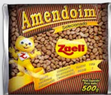
Amendoim Beneficiado Branco Maní Sin Cáscara Blanco Processed White Peanuts SAP: 100827 | 10x500g DUN 14: 1 789618390724 9 EAN 13: 7 89618390724 2 NCM: 1202.42.00