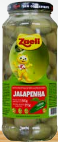
Azeitona Verde Recheada Jalapenha Aceituna Recheada Jalapenha Stuffed Olive Jalapenha SAP: 102741 | 12x370g DUN 14: 1 7896183 90962 5 EAN 13: 7 896183 90962 8 NCM: 2005.70.00