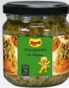
Patê de Azeitona Verde com Alcaparras Patê de Aceituna Verde con Alcaparra Green Olive Pate with Capers SAP: 102712 | 12x185g DUN 14: 1 789618390929 8 EAN 13: 7 89618390929 1 NCM: 2104.20.00