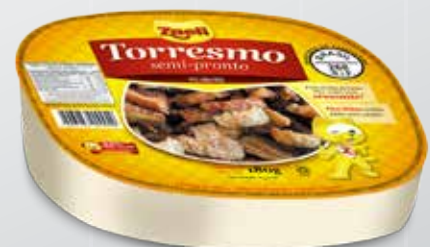
Torresmo Semi-Pronto 180g SAP: 102808 | 10x180g DUN 14: 1 7896183 90994 6 EAN 13: 7 896183 90994 9 NCM: 0210.19.00