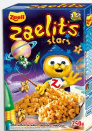
Cereal Matinal Stars (leite condensado) Cereal Matinal Stars (leche condensado) Stars Cereal (condensed milk) SAP: 100074 | 6x250g DUN 14: 2 789618390607 2 EAN 13: 7 89618390607 8 NCM: 1904.10.00