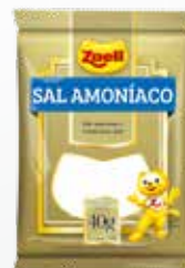
Sal Amóniaco Sal Amoniaco Ammoniac Salt SAP: 100098 | 20x40g DUN 14: 1 789618390096 7 EAN 13: 7 89618390096 0 NCM: 2501.00.90