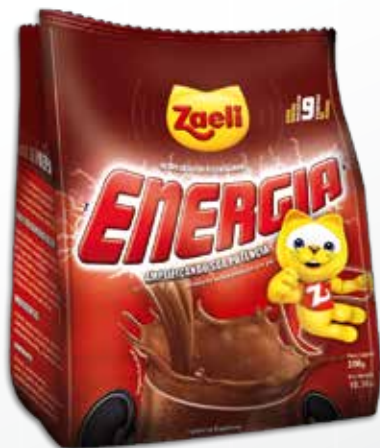
Achocolatado Energia Achocolatado Energia "Energia" Powdered Chocolate SAP: 100001 | 12x300g DUN 14: 1 789618390511 5 EAN 13: 7 89618390511 8 NCM: 1806.90.00