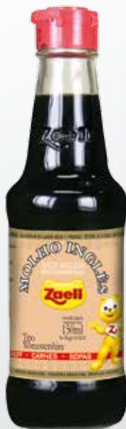
Molho Inglês Salsa Inglesa Worcester Sauce SAP: 100165 | 12x150ml DUN 14: 1 789618390296 1 EAN 13: 7 89618390296 4 NCM: 2103.10.10