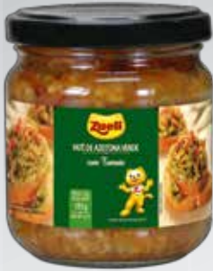
Patê de Azeitona Verde com Tomate Patê de Aceituna Verde con Tomate Green Olive Pate with Tomato SAP: 102714 | 12x185g DUN 14: 1 789618390931 1 EAN 13: 7 89618390931 4 NCM: 2104.20.00