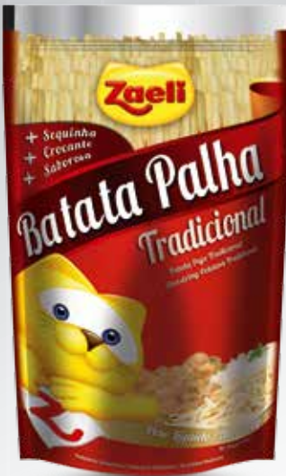
Batata Palha Tradicional Pouchet Patata Paja Tradicional Pouchet Traditional Straw Potato Pouchet SAP: 102700 | 20x140g DUN 14: 1 789618390832 1 EAN 13: 7 89618390832 4 NCM: 2005.20.00