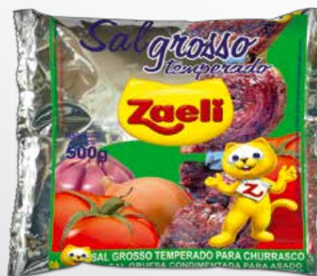
Sal Grosso Temperado Sal Gruesa Templada Seasoned Coarse Salt SAP: 100204 | 20x500g DUN 14: 1 789618390519 1 EAN 13: 7 89618390519 4 NCM: 2501.00.20