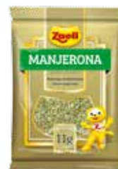
Manjerona Desidratada Manjerona Deshidratada Basil SAP: 100102 | 20x11g DUN 14: 1 789618390420 0 EAN 13: 7 89618390420 3 NCM: 0712.90.90