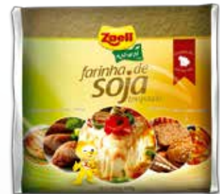
Farinha de Soja Temperada Harina de Soja Temperada Soy Flour Temperate SAP: 101205 | 10x500g DUN 14: 1 789618390734 8 EAN 13: 7 89618390734 1 NCM: 1208.10.00