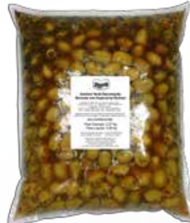
Azeitona Marinado com Especiarias Siciliana Aceituna Marinado en Especias Sicilianas Marinated Olives with Sicilian Spices SAP: 102708 | 2x2,27kg DUN 14: 1 789618390946 5 EAN 13: 7 89618390946 8 NCM: 2005.70.00