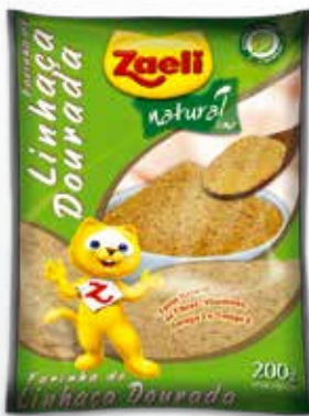
Farinha de Linhaça Dourada Harina de Linaza Dorada Golden Flaxseed Meal SAP: 100896 | 10x200g DUN 14: 1 789618390726 3 EAN 13: 7 89618390726 6 NCM: 1208.90.00