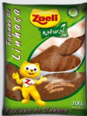
Farinha de Linhaça Marrom Harina de Linaza Marrom Brown Flaxseed Meal SAP: 100897 | 10x200g DUN 14: 1 789618390725 6 EAN 13: 7 89618390725 9 NCM: 1208.90.00