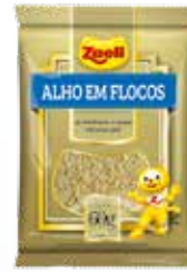
Alho Desidratado em Flocos Ajo en Escamas Dehydrated Garlic Flakes SAP: 100080 | 20x60g DUN 14: 1 789618390295 4 EAN 13: 7 89618390295 7 NCM: 0712.90.90