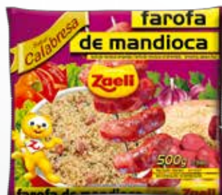
Farofa de Mandioca Calabresa Harina de Mandioca Condimentada Calabresa Seasoned Cassava Flour Calabresa Flavor SAP: 101269 | 20x500g DUN 14: 2 789618390550 1 EAN 13: 7 89618390550 7 NCM: 1106.20.00