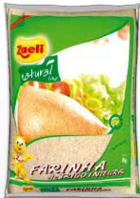
Farinha de Trigo Integral Harina de Trigo Integral Integral Wheat Flour SAP: 100195 | 10x1kg DUN 14: 2 789618390163 3 EAN 13: 7 89618390163 9 NCM: 1101.00.10