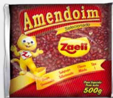
Amendoim Beneficiado Vermelho Maní Sin Cáscara Rojo Processed Red Peanuts SAP: 100006 | 10x500g DUN 14: 2 789618390041 4 EAN 13: 7 89618390041 0 NCM: 1202.20.90