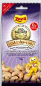
Castanha de Cajú Castaña de Acajú Cashew Nuts SAP: 100019 | 30x50g DUN 14: 1 789618390582 5 EAN 13: 7 89618390582 8 NCM: 2008.19.00