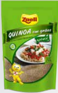
Quinoa em Grãos Granos de Quinoa Quinoa grains SAP: 102750 | 6x250g DUN 14: 1 7896183 90969 4 EAN 13: 7 896183 90969 7 NCM: 1904.90.00