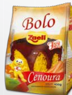
Mist. p/ Bolo sabor Cenoura Mezcla p/ Torta sabor Zanahoria Cake Mix - Carrot Flavor SAP: 100162 | 12x450g DUN 14: 1 789618390593 1 EAN 13: 7 89618390593 4 NCM: 1901.20.00