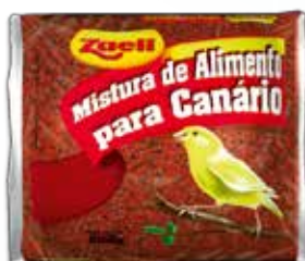
Mistura de Alimento para Canário Mezcla de Alimento para el Canario Mixed Bird Food "Canary" SAP: 100181 | 10x500g DUN 14: 1 789618390145 2 EAN 13: 7 89618390145 5 NCM: 1008.90.90