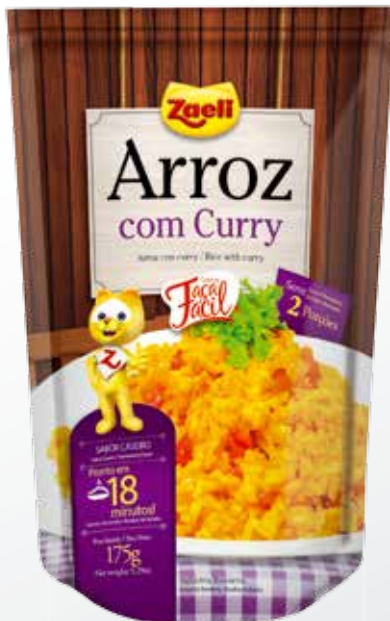
Arroz com Curry Arroz con Curry Rice with Curry SAP: 102425 | 12x175g DUN 14: 1 789618390916 8 EAN 13: 7 89618390916 1 NCM: 2104.20.00