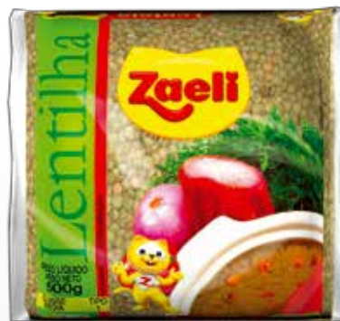
Lentilha Lenteja Lentil SAP: 100141 | 10x500g DUN 14: 2 789618390084 1 EAN 13: 7 89618390084 7 NCM: 0713.40.90