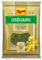
Orégano Desidratado Oregano Desecado Dehydrated Oregano SAP: 100095 | 20x7g DUN 14: 1 789618390095 0 EAN 13: 7 89618390095 3 SAP: 102746 | 10x20g DUN 14: 1 789618390965 6 EAN 13: 7 89618390965 9 NCM: 1211.90.10