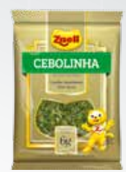
Cebolinha Cebollita Green Onion SAP: 100088 | 20x6g DUN 14: 1 789618390292 3 EAN 13: 7 89618390292 6 NCM: 0712.20.00