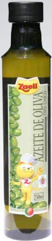
Azeite de Oliva Tipo Único Aceite de Oliva Tipo Unico Olive Oil Only Type SAP: 102795 | 12x250ml DUN 14: 1 789618390997 7 EAN 13: 7 89618390997 0 NCM: 1509.10.00