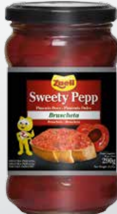
Sweety Pepp Bruschetta Sweety Pepp Bruschetta Sweety Pepp Bruschetta SAP: 102732 | 12x290g DUN 14: 1 7896183 90971 7 EAN 13: 7 896183 90971 0 NCM: 2001.90.00

Sweety Pepp é um tipo único de pimenta que cresce nas terras altas do Peru, seu sabor único é doce e suavemente picante. Pode ser servido como aperitivo e agrega valor a uma variedade de pratos ou itens de padaria.