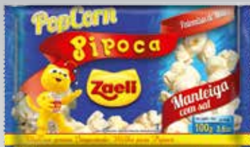
Pipoca para Micro-ondas Manteiga Maiz para Microondas Mantequilla Microwave Popcorn - Butter Flavor SAP: 100192 | 24x100g DUN 14: 1 789618390181 0 EAN 13: 7 89618390181 3 NCM: 2008.19.00