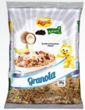
Gran.Integ. c/ Uvas passas e Banana Gran. Integ. c/ Uvas pasas y Plátano Whole Granola with Raisins and Banana SAP: 102697 | 12x300g DUN 14: 1 789618390945 8 EAN 13: 7 89618390945 1 NCM: 1904.90.00