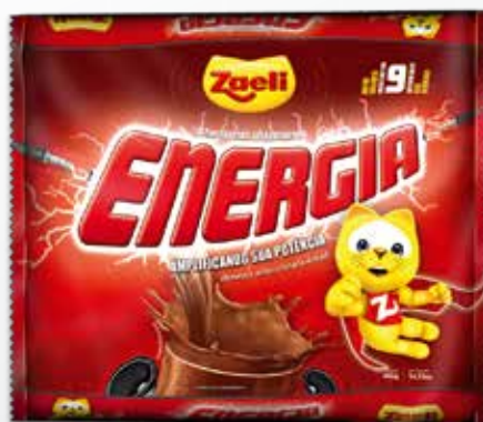
Achocolatado Energia Achocolatado Energia "Energia" Powdered Chocolate SAP: 101265 | 20x400g DUN 14: 1 789618390164 3 EAN 13: 7 89618390164 6 NCM: 1806.90.00