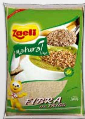
Fibra de Trigo Fibra de Trigo | Wheat Fiber SAP: 100197 | 10x300g DUN 14: 1 789618390605 1 EAN 13: 7 89618390605 4 NCM: 2302.30.90