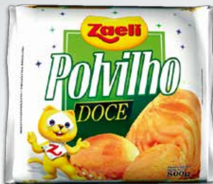
Polvilho Doce Almidón Dulce Sweet Starch SAP: 101273 | 20x500g DUN 14: 2 789618390046 9 EAN 13: 7 89618390046 5 NCM: 1108.14.00