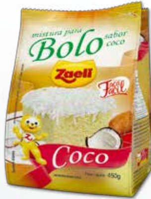
Mistura para Bolo sabor Coco Mezcla para Torta sabor Coco Cake Mix - Coconut Flavor SAP: 100156 | 12x450g DUN 14: 1 789618390476 7 EAN 13: 7 89618390476 0 NCM: 1901.20.00