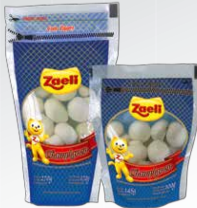
Champignon Champiñon Mushroom SAP: 100838 | 12x100g DUN 14: 1 789618390723 2 EAN 13: 7 89618390723 5 SAP: 101403 | 12x170g DUN 14: 1 789618390831 4 EAN 13: 7 89618390831 7 NCM: 2003.10.00