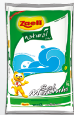
Sal Marinho Sal Marino Sea Salt SAP: 100201 | 30x1kg DUN 14: 2 789618390322 4 SAP: 102728 | 10x1kg DUN 14: 3 789618390322 1 EAN 13: 789618390322 0 NCM: 2501.00.20