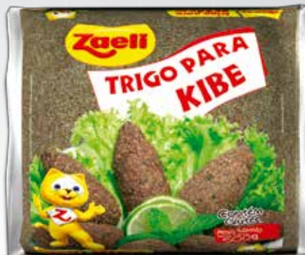
Trigo para Kibe Harina para Kibe Wheat Flour For "Kibe" SAP: 100122 | 10x500g DUN 14: 1 789618390059 2 EAN 13: 7 89618390059 5 NCM:1104.19.00