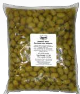
Azeitona Recheada com Jalapeño Aceituna Recheada con Jalapeño Stuffed Olives with Jalapeño Pepper SAP: 102706 | 2x2,27kg DUN 14: 1 789618390949 6 EAN 13: 7 89618390949 9 NCM: 2005.70.00