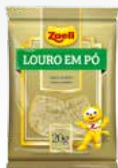
Louro em Pó Laurel en Polvo Powdered Bayleaf SAP: 100092 | 20x20g DUN 14: 1 789618390417 0 EAN 13: 7 89618390417 3 NCM: 0910.99.00