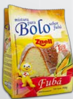
Mistura para Bolo sabor Fubá Mezcla para Torta sabor Maiz Cake Mix - Maize Flavor SAP: 100158 | 12x450g DUN 14: 1 789618390478 1 EAN 13: 7 89618390478 4 NCM: 1901.20.00