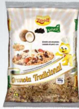
Gran. Integ. c/ Castanha-do- Pará e Coco Gran. Integ. c/ Castaña-do-Pará y Coco Whole Granola with Chesnut-of-Pará and Coco SAP: 102698 | 12x300g DUN 14: 1 789618390944 1 EAN 13: 7 89618390944 4 NCM: 1904.90.00