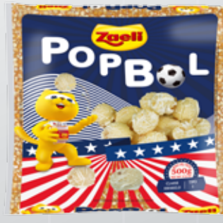
Pipoca PopBol Pororó PopBol PopBol Popcorn SAP: 102906 | 10x500g DUN 14: 1 789618391008 9 EAN 13: 7 89618391008 2 NCM: 1005.90.10