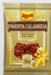
Pimenta Calabresa Pimienta Calabresa en Escamas Calabrese Pepper Flakes SAP: 102577 | 20x30g DUN 14: 1 789618390925 0 EAN 13: 789618390925 3 NCM: 0904.12.00