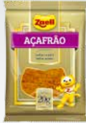
Açafrão em Pó Azafraan en polvo Powdered Turmeric SAP: 100103 | 20x20g DUN 14: 1 789618390422 4 EAN 13: 789618390422 7 NCM: 0910.20.00