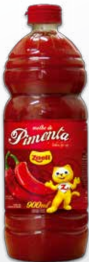
Molho de Pimenta 900ml Salsa de Pimienta Roja 900ml Pepper Sauce SAP: 100169 | 6x900ml DUN 14: 1 789618390305 0 EAN 13: 7 89618390305 3 NCM: 2103.90.21