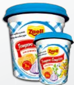
Tempero Completo sem Pimenta Sazonador Completo sem Pimienta Complete Seasoning Without Pepper SAP: 100214 | 24x300g DUN 14: 2 789618390116 9 EAN 13: 7 89618390116 5 SAP: 100215 | 6x1kg DUN 14: 1 789618390207 7 EAN 13: 7 89618390207 0 NCM: 2103.90.21