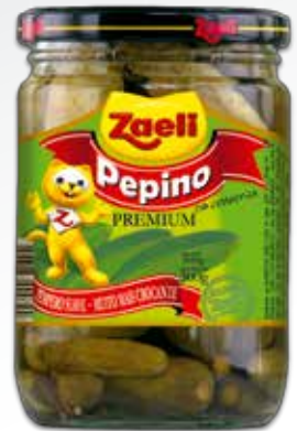
Pepino Pepino Cucumber SAP: 100182 | 15x300g DUN 14: 1 789618390072 1 EAN 13: 7 89618390072 4 NCM: 2001.10.00