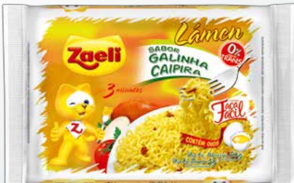
Macarrão Instantâneo Galinha Caipira Macarrão Instantaneo Pollo Instant Noodles - Chicken Flavor SAP: 102222 | 50x85g DUN 14: 2 789618390568 6 EAN 13: 7 89618390568 2 NCM: 1902.30.00