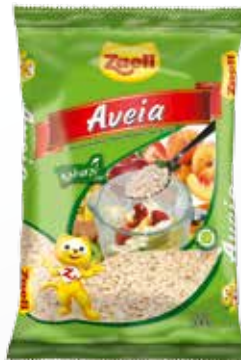
Aveia em Flocos Grossos Avena en Escamas Gruesa Coarse Oat Flakes SAP: 102969 | 12x500g DUN 14: 1 7896183 91011 9 EAN 13: 7 896183 91011 2 NCM: 1104.12.00