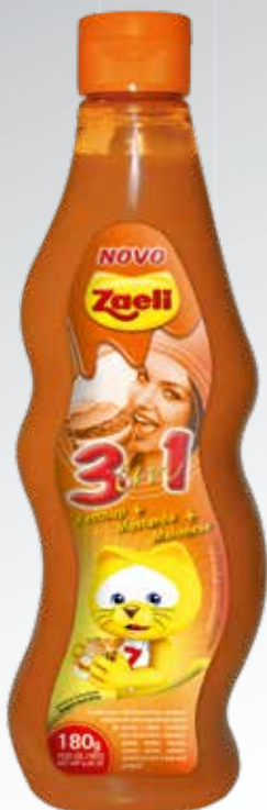
3 em 1/3 en 1/3 in 1 SAP: 101517 | 12x180g DUN 14: 1 789618390863 5 EAN 13: 7 89618390863 8 SAP: 101516 | 12x370g DUN 14: 1 789618390862 8 EAN 13: 7 89618390862 1 NCM: 2103.90.21