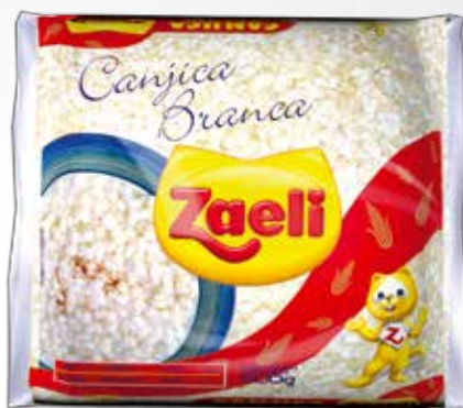
Canjica Branca Maiz Blanco Partido White Hominy (Ou Grits With Corn) SAP: 100115 | 10x500g DUN 14: 2 789618390034 6 EAN 13: 7 89618390034 2 NCM: 1104.23.00