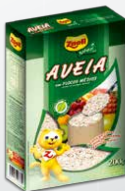
Aveia em Flocos Médios Avena en Escamas Medio Average Oat Flakes SAP: 101376 | 10x200g DUN 14: 1 789618390637 2 EAN 13: 7 89618390637 5 NCM: 1104.12.00