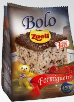
Mistura para Bolo Formigueiro Mezcla para Torta Formigüero Cake Mix - Anthill Flavor SAP: 101248 | 12x450g DUN 14: 1 789618390801 7 EAN 13: 7 89618390801 0 NCM: 1901.20.00