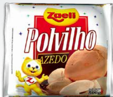
Polvilho Azedo Almidón Acido Sour Starch SAP: 101272 | 20x500g DUN 14: 2 789618390045 2 EAN 13: 7 89618390045 8 NCM: 1108.14.00