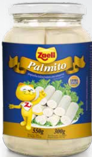
Palmito Inteiro 300g Palmito Intero 300g Hearts Of Palm 10,6oz SAP: 102232 | 15x300g DUN 14: 1 789618390897 0 EAN 13: 7 89618390897 3 NCM: 2008.91.00