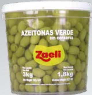
Azeitona Verde com Carozo Aceituna Verde con Carozo Green Olives With Pit SAP: 101938 | 1,8kg EAN 13: 7 89618390880 5 NCM: 2005.70.00