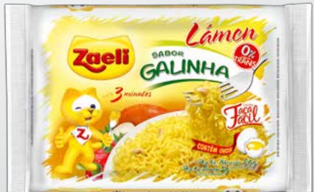
Macarrão Instantâneo Galinha Macarrão Instantaneo Pollo Instant Noodles - Chicken Flavor SAP: 102226 | 50x85g DUN 14: 2 789618390571 6 EAN 13: 7 89618390571 2 NCM: 1902.30.00