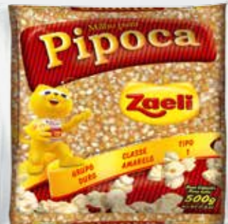
Pipoca Americana Pororó Americano American Popcorn SAP: 102355 | 20x500g DUN 14: 1 789618390912 0 EAN 13: 7 89618390912 3 NCM: 1005.90.10