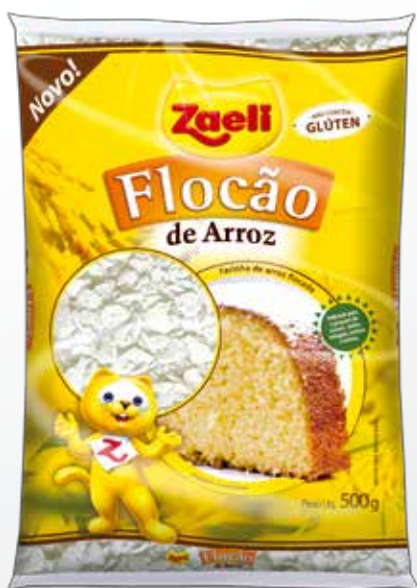
Flocão de Arroz Copo de Arroz "Flocão" Flakes Rice SAP: 100107 | 10x500g DUN 14: 1 789618390643 3 EAN 13: 7 89618390643 6 NCM: 1904.90.00