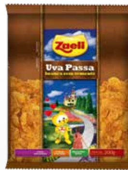
Uva Passa Branca Uva Pasa Blanca White Raisin SAP: 101837 | 12x200g DUN 14: 1 789618390823 9 EAN 13: 789618390823 2 NCM: 0806.20.00