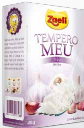
Tempero Meu Sabor Alho Tempero Mi Ajo My Seasoning Garlic SAP: 101129 | 24x40g DUN 14: 1 789618390748 5 EAN 13: 7 89618390748 8 NCM: 2103.90.21