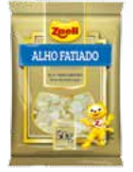
Alho Desidratado Fatiado Ajo Laminado deshidratado Dehydrated Garlic Sliced SAP: 102565 | 20x50g DUN 14: 1 789618390222 9 EAN 13: 7 89618390222 9 NCM: 0712.90.90