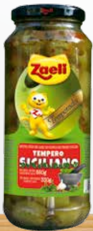
Azeit. Verde sem Car. Tempero Siciliano Aceit. Verde Sin Caroço Tempero Siciliano Green olives, pitted Sicilian seasoning SAP: 102743 | 12x330g DUN 14: 1 7896183 90964 9 EAN 13: 7 896183 90964 2 NCM: 2005.70.00