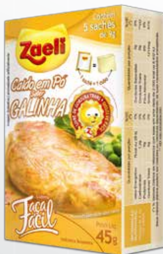
Caldo em Pó Sabor Galinha Caldo en Polvo Sabor Gallina Powder Seasoning Flavor Chicken SAP: 100470 | 24x45g DUN 14: 1 789618390646 4 EAN 13: 7 89618390646 7 NCM: 2103.90.21