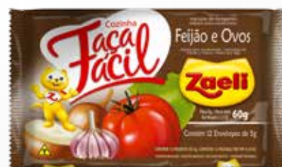
Mistura de Temperos Faça Fácil - Feijão, Ovos e Arroz Mezcla de Temperos Faça Fácil - Poroto, Ovos, Arroz "Faça Fácil" Seasoning - Bean, Eggs and Rice SAP: 100218 | 24x60g DUN 14: 1 789618390321 0 | EAN 13: 7 89618390321 3 NCM: 2103.90.21