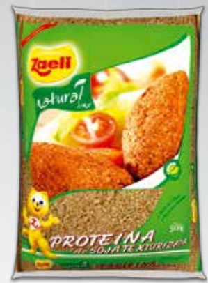
Proteína de Soja Texturizada Proteína de Soya Texturizada Soya Beans Texturized Protein SAP: 100196 | 10x500g DUN 14: 1 789618390170 4 EAN 13: 7 89618390170 7 NCM: 3504.00.20