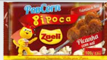
Pipoca para Micro-ondas Picanha Maiz para Microondas Picanha Microwave Popcorn - Steak Flavor SAP: 100730 | 24x100g DUN 14: 1 789618390677 8 EAN 13: 7 89618390677 1 NCM: 2008.19.00