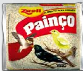
Painço Mijo Millet SAP: 100176 | 10x500g DUN 14: 1 789618390062 2 EAN 13: 7 89618390062 5 NCM: 1008.29.00