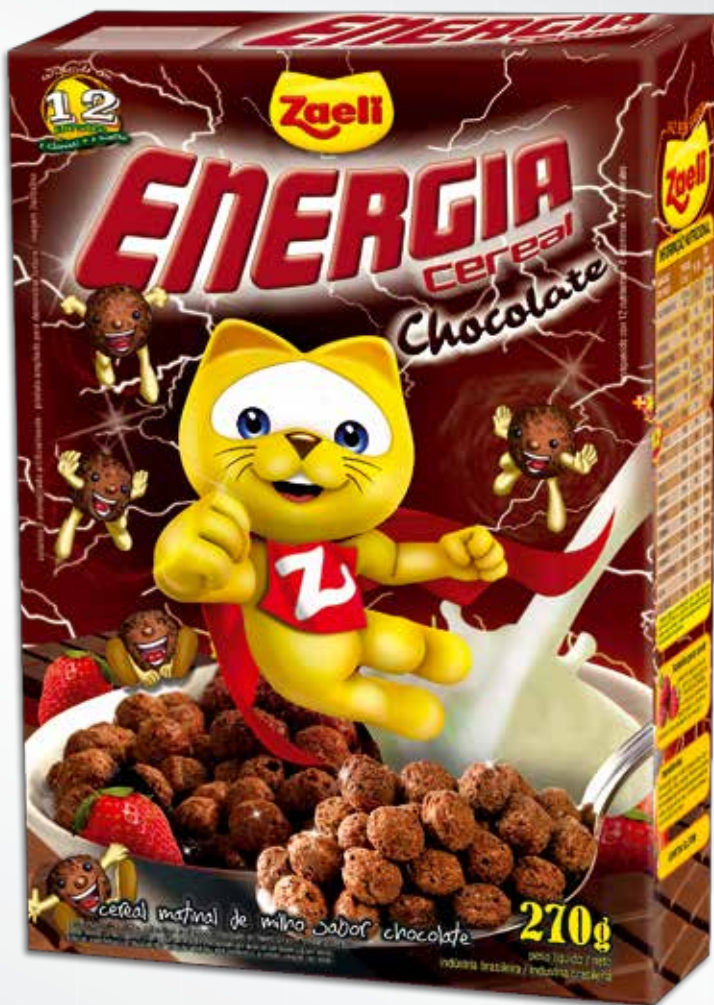
Cereal Energia Chocolate Cereal Energia Chocolate "Energia" Chocolate Cereal SAP: 100070 | 12x270g DUN 14: 2 789618390608 2 EAN 13: 7 89618390608 5 NCM: 1904.10.00

Os cereais matinais Zaeli são enriquecidos com 12 nutrientes (8 vitaminas e 4 minerais), obtidos a partir de 5 tipos de farinhas de cereais: Arroz, Aveia, Soja, Milho e Trigo. O processo produtivo de última geração totalmente automatizado e contínuo faz com que o produto processado seja sempre uniforme, higiênico e sem variações. Essas características e a utilização da soja os diferenciam dos demais do mercado.