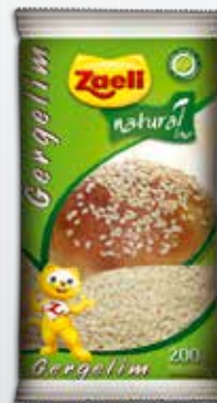
Gergelim | Sésamo | Sesame SAP: 100899 | 10x200g DUN 14: 1 789618390730 0 EAN 13: 7 89618390730 3 NCM: 1207.40.90