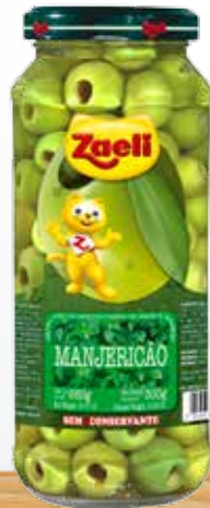
Azeit. Verde sem Caroço Manjeriçao Aceituna Verde Sin Caroço Manjeriçao Pitted Olives Manjeriçao SAP: 102738 | 12x300g DUN 14: 1 7896183 90958 8 EAN 13: 7 896183 90958 1 NCM: 2005.70.00