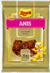
Anis Estrelado Anis Estrellado Anis Starry SAP: 102928 | 20x20g DUN 14: 1 789618391003 4 EAN 13: 789618391003 7 NCM: 0909.61.20