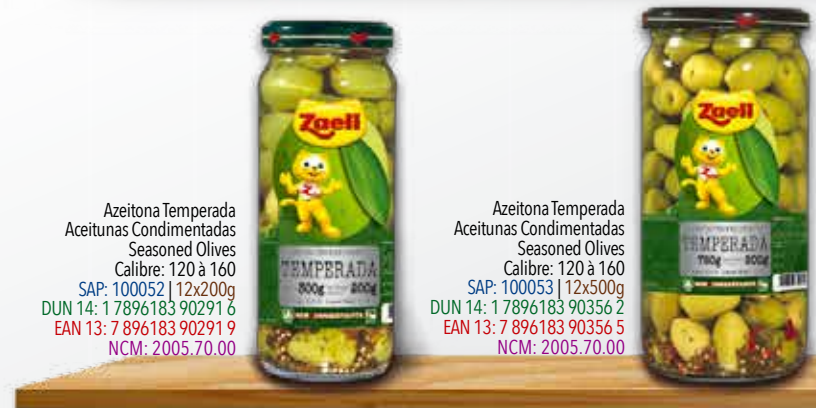
Azeitona Temperada Aceitunas Condimentadas Seasoned Olives Calibre: 120 à 160 SAP: 100052 | 12x200g DUN 14: 1 7896183 90291 6 EAN 13: 7 896183 90291 9 NCM: 2005.70.00