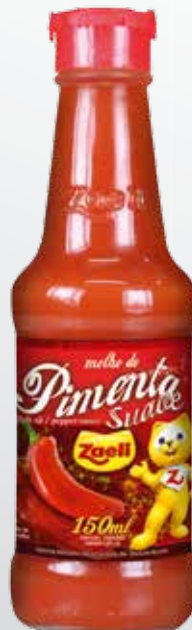
Molho de Pimenta Salsa de Pimenta Roja Pepper Sauce

SAP: 100166 | 12x150ml DUN 14: 1 789618390426 2 EAN 13: 7 89618390426 5 NCM: 2103.90.21