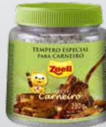
Tempero Especial Carneiro Condimento Esp. p/ Carnero Special Mutton Seasoning SAP: 101955 | 12x280g DUN 14: 1 789618390885 7 EAN 13: 7 89618390885 0 NCM: 2103.90.21