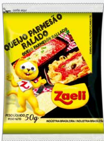
Queijo Parmesão Ralado Queso Rallado Grated Chesse SAP: 100200 | 20x50g DUN 14: 1 789618390209 1 EAN 13: 7 89618390209 4 NCM: 0406.20.00