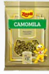
Camomila Manzanilla Camomile SAP: 100084 | 20x7g DUN 14: 1 789618390103 2 EAN 13: 789618390103 5 NCM: 0902.20.00