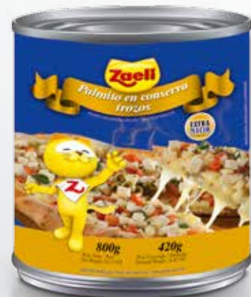
Palmito Picado 420g Palmito Picado 420g Hearts Of Palm Cuts 14,8oz SAP: 102300 | 12x420g DUN 14: 1 789618390904 5 EAN 13: 7 89618390904 8 NCM: 2008.91.00