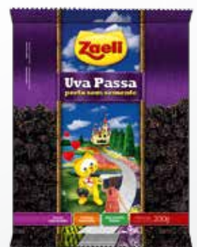
Uva Passa Passas de Uva Raisins SAP: 101406 | 12x200g DUN 14: 1 789618390821 5 EAN 13: 789618390821 8 NCM: 0806.20.00