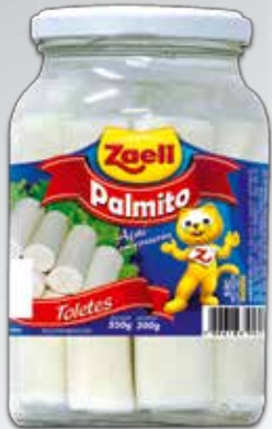
Palmito Palmito Hearts Of Palm SAP: 100170 | 15x300g DUN 14: 2 789618390217 3 EAN 13: 7 89618390217 9 NCM: 2008.91.00