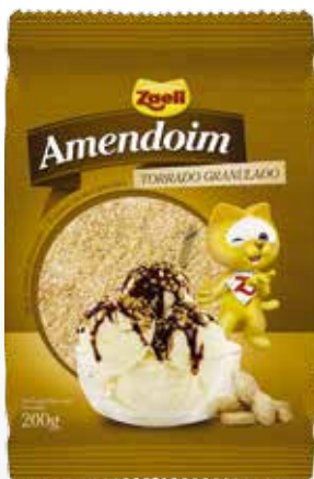
Amendoim Torrado Granulado Maní Tostado Granulado Roasted Peanut Granules SAP: 102146 | 10x200g DUN 14: 1 789618390858 1 EAN 13: 7 89618390858 4 NCM: 2008.11.00