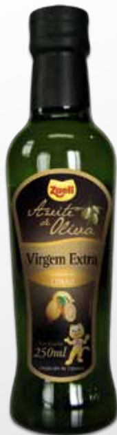
Az. Ext. Vir. Sabor Limão Aceite Oliva Ext. Vir. Limón Ext. Vir. Olive Oil Lemon SAP: 100865 | 6x250ml DUN 14: 1 789618390719 5 EAN 13: 7 89618390719 8 NCM: 1509.10.00