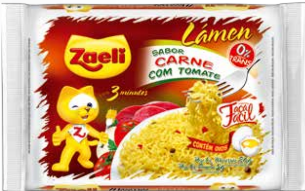
Macarrão Instantâneo Carne com Tomate Macarrão Instantaneo Carne com Tomate Instant Noodles - Meat and Tomatoes Flavor SAP: 102223 | 50x85g DUN 14: 2 789618390573 0 EAN 13: 7 89618390573 6 NCM: 1902.30.00