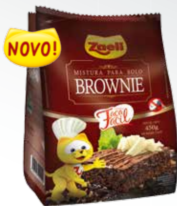
Mistura para Bolo Brownie Mezcla para Torta Brownie Cake Mix - Brownie SAP: 102907 | 12x450g DUN 14: 1 789618391002 7 EAN 13: 7 89618391002 0 NCM: 1901.20.00