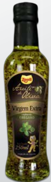
Az. Ext. Vir. Sabor Orégano Aceite Oliva Ext. Vir. Orégano Ext. Vir. Olive Oil Oregano SAP: 100864 | 6x250ml DUN 14: 1 789618390718 8 EAN 13: 7 89618390718 1 NCM: 1509.10.00