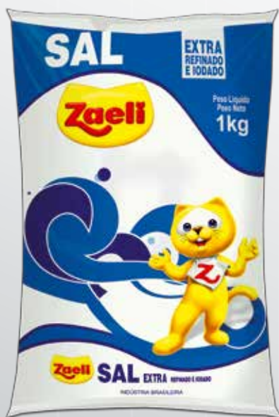
Sal Refinado Sal Refinado Refined Salt SAP: 100202 | 30x1kg DUN 14: 1 789618390132 2 EAN 13: 7 89618390132 5 NCM: 2501.00.20

O Queijo Ralado Zaeli é obtido somente do queijo tipo parmesão, sem adição ou mistura de outros tipos de queijo de qualidade inferior, garantindo qualidade e sabor inigualável.