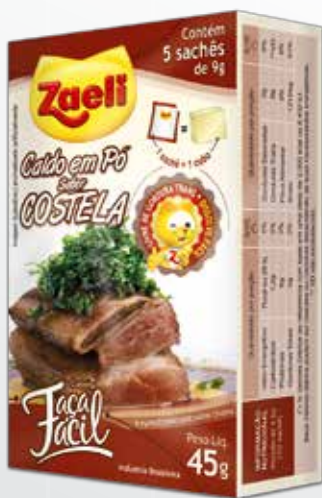
Caldo em Pó Sabor Costela Caldo en Polvo Sabor Costilla Powder Seasoning Flavor Rib SAP: 100472 | 24x45g DUN 14: 1 789618390645 7 EAN 13: 7 89618390645 0 NCM: 2103.90.21