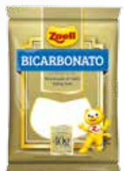
Bicarbonato de Sódio Bicarbonato de Sodio Baking Soda SAP: 100083 | 20x40g DUN 14: 1 789618390100 1 EAN 13: 7 89618390100 4 NCM: 2836.30.00