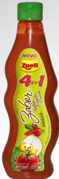
4 em 1/4 en 1/4 in 1 SAP: 101515 | 12x180g DUN 14: 1 789618390866 6 EAN 13: 7 89618390866 9 SAP: 101482 | 12x370g DUN 14: 1 789618390865 9 EAN 13: 7 89618390865 2 NCM: 2103.90.21