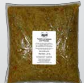
Picadillo de Azeitona com Pimentão Picadillo de Aceituna con Pimentón Picadillo Olives with Pepper SAP: 102694 | 3x2,27kg DUN 14: 1 789618390948 9 EAN 13: 7 89618390948 2 SAP: 102705 | 2x2,27kg DUN 14: 1 789618390947 2 EAN 13: 7 89618390947 5 NCM: 2104.20.00