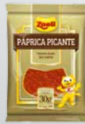
Páprica Picante Paprika Picante Spicy Paprika SAP: 102586 | 20x30g DUN 14: 1 789618390927 4 EAN 13: 789618390927 7 NCM: 0904.22.00