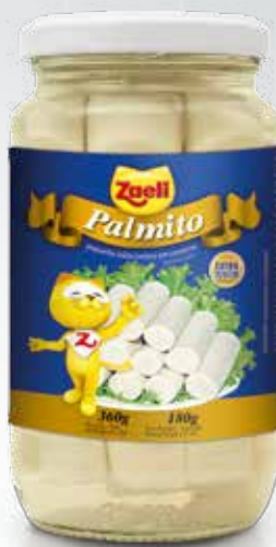
Palmito Inteiro 180g Palmito Intero 180g Hearts Of Palm 6,3oz SAP: 102242 | 24x180g DUN 14: 1 789618390896 3 EAN 13: 7 89618390896 6 NCM: 2008.91.00