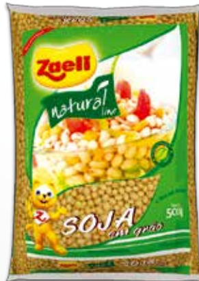
Soja em Grãos Soya en Granos Soya Beans SAP: 100142 | 10x500g DUN 14: 2 789618390532 7 EAN 13: 7 89618390532 3 NCM: 1201.90.00