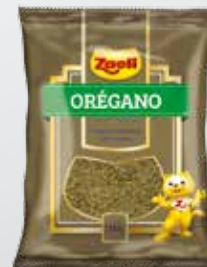
Orégano Desidratado 200g Oregano Desecado Dehydrated Oregano SAP: 102752 | 5x200g DUN 14: 1 789618390966 3 EAN 13: 789618390966 6 NCM: 1211.90.10