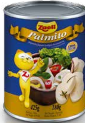
Palmito Fatiado 180g Palmito Fatiado 180g Hearts Of Palm Slice 6,3oz SAP: 102144 | 20x180g DUN 14: 1 789618390901 4 EAN 13: 7 89618390901 7 NCM: 2008.91.00