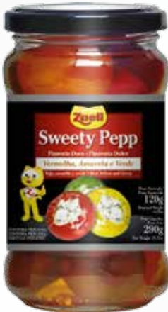
Sweety Pepp Vermelho, Amarelo e Verde Sweety Pepp Rojo, Amarillo y Verde Sweety pepp Red, Yellow and Green SAP: 102734 | 12x290g DUN 14: 1 7896183 90973 1 EAN 13: 7 896183 90973 4 NCM: 2001.90.00