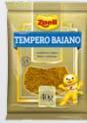
Tempero Baiano Condimento Baiano Baiano Seasoning SAP: 100882 | 20x40g DUN 14: 1 789618390737 9 EAN 13: 789618390737 2 NCM: 2103.90.21