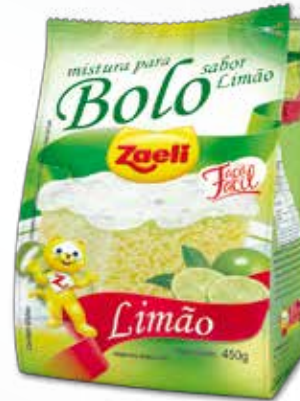
Mistura para Bolo sabor Limão Mezcla para Torta sabor Limón Cake Mix - Lemon Flavor SAP: 100160 | 12x450g DUN 14: 1 789618390500 9 EAN 13: 7 89618390500 2 NCM: 1901.20.00