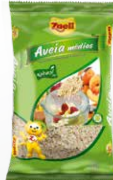
Aveia em Flocos Médios Avena en Escamas Medio Average Oat Flakes SAP: 102970 | 12x400g DUN 14: 1 7896183 91012 6 EAN 13: 7 896183 91012 9 NCM: 1104.12.00