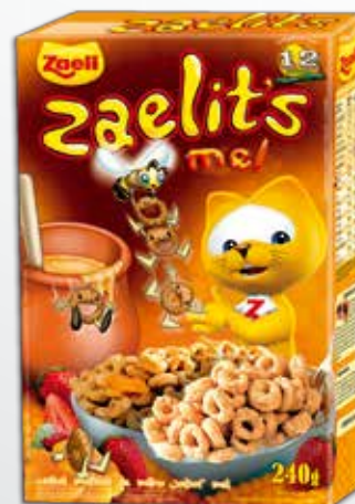
Cereal Matinal Mel Cereal Matinal Miel Honey Cereal SAP: 100072 | 6x240g DUN 14: 2 789618390609 6 EAN 13: 7 89618390609 2 NCM: 1904.10.00