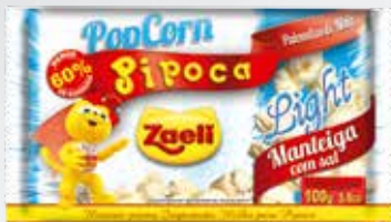
Pipoca para Micro-ondas Manteiga Light Maiz para Microondas Manteiga Light Microwave Popcorn - Light Butter Flavor SAP: 100252 | 12x100g DUN 14: 2 789618390389 7 EAN 13: 7 89618390389 3 NCM: 2008.19.00