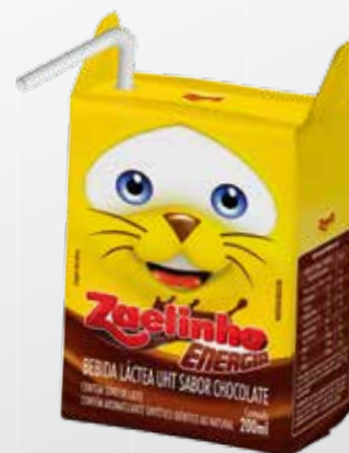
Bebida Láctea Chocolate Zaelinho Energia Bebida Láctea Chocolate Zaelinho Energia Chocolate Milk Drink "Zaelinho" SAP: 102693 | 27x200ml DUN 14: 1 789618390943 4 EAN 13: 7 89618390943 7 NCM: 2202.90.00