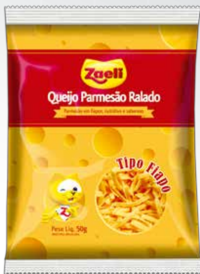
Queijo Parmesão Ralado Tipo Fiapo Queso Parmesano Hilas Parmesan Lint SAP: 101203 | 20x50g DUN 14: 1 789618390741 6 EAN 13: 7 89618390741 9 NCM: 0406.20.00

O Queijo Ralado Zaeli é obtido somente do queijo tipo parmesão, sem adição ou mistura de outros tipos de queijo de qualidade inferior, garantindo qualidade e sabor inigualável.