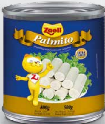
Palmito Inteiro 500g Palmito Intero 500g Hearts Of Palm 17,6oz SAP: 102247 | 12x500g DUN 14: 1 789618390899 4 EAN 13: 7 89618390899 7 NCM: 2008.91.00