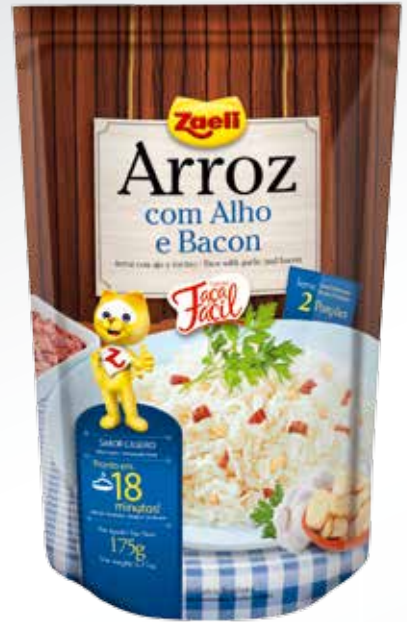
Arroz com Alho e Bacon Arroz con Ajo y Tocino Rice with Garlic and Bacon SAP: 102437 | 12x175g DUN 14: 1 789618390914 4 EAN 13: 7 89618390914 7 NCM: 2104.20.00