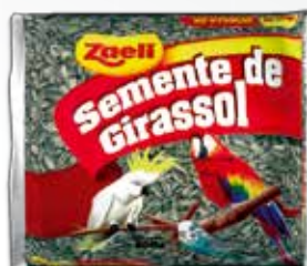
Semente de Girassol Semillas de Girasol Sunflower Seed SAP: 100177 | 10x500g DUN 14: 1 789618390063 9 EAN 13: 7 89618390063 2 NCM: 1206.00.90

Os alimentos para aves Zaeli são desenvolvidos balanceando os ingredientes que são mais apreciados por cada espécie de pássaro. Todo o processo de desenvolvimento é elaborado por um especialista e é acompanhado pelo Ministério da Agricultura.