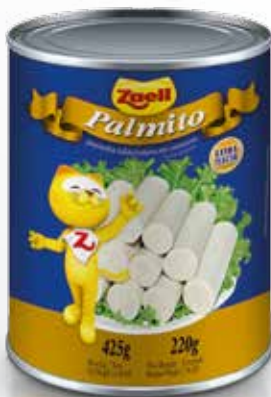
Palmito Inteiro 220g Palmito Intero 220g Hearts Of Palm 7,7oz SAP: 102249 | 20x220g DUN 14: 1 789618390898 7 EAN 13: 7 89618390898 0 NCM: 2008.91.00