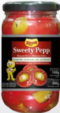
Sweety Pepp Recheada com Azeitonas Sweety Pepp Rellenas con Aceitunas Sweety pepp Stuffed with Olives SAP: 102731 | 12x290g DUN 14: 1 7896183 90972 4 EAN 13: 7 896183 90972 7 NCM: 2001.90.00