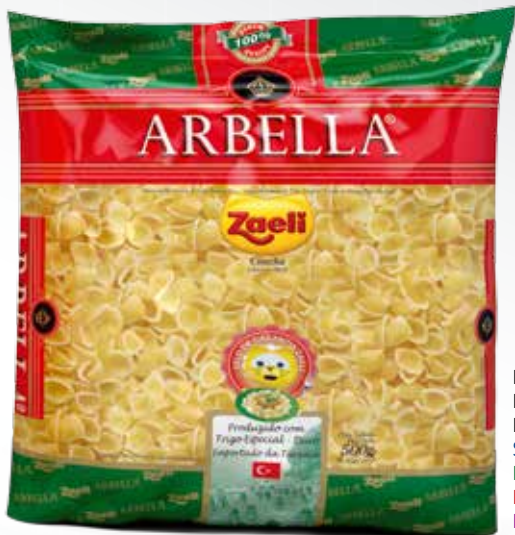
Massa Grano Duro - Concha Massa Durum - Concha Pasta Durum - Shell SAP: 101969 | 20x500g DUN 14: 1 789618390876 5 EAN 13: 7 89618390876 8 NCM: 1902.19.00