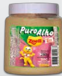
Tempero Puro Alho Condimento de Ajo Puro "Puro Alho" Seasoning Garlic SAP: 100216 | 12x280g DUN 14: 1 789618390446 0 EAN 13: 7 89618390446 3 NCM: 2103.90.21