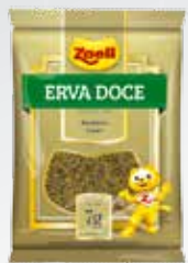
Erva Doce Hierba Dulce Fennel Seeds SAP: 100090 | 20x7g DUN 14: 1 789618390094 3 EAN 13: 7 89618390094 6 NCM: 0909.61.10