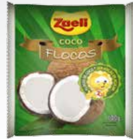
Coco Ralado em Flocos Coco Rallado en Escamas Grated Coconut In Flakes SAP: 100879 | 20x100g DUN 14: 1 789618390740 9 EAN 13: 7 89618390740 2 NCM: 0801.11.10