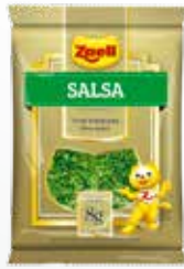
Salsa Desidratada Perejil Dehydrated Parsley SAP: 100099 | 20x8g DUN 14: 1 789618390294 7 EAN 13: 7 89618390294 0 NCM: 0712.90.90