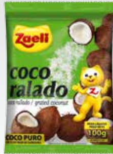
Coco Ralado Coco Rallado Grated Coconut SAP: 100206 | 48x50g DUN 14: 1 789618390179 7 EAN 13: 7 89618390179 0 SAP: 100205 | 24x100g DUN 14: 1 789618390180 3 EAN 13: 7 89618390180 6 NCM: 0801.11.00