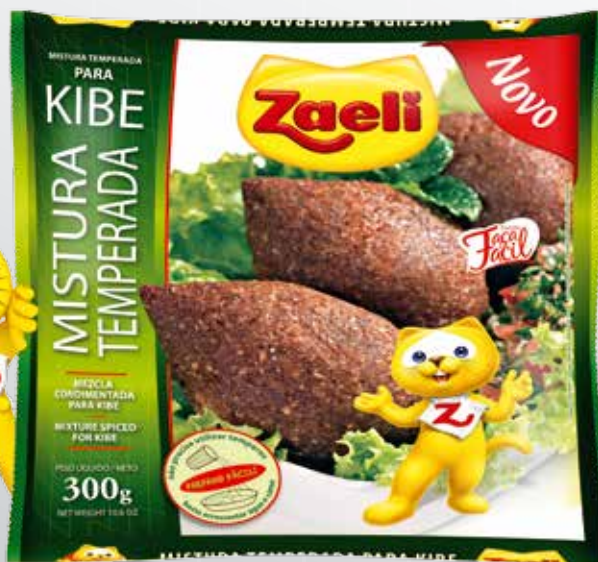
Mistura Temperada para Kibe Mezcla Condimentada para Kibe Spiced Kibbeh Mixture SAP: 101484 | 10x300g DUN 14: 1 789618390619 8 EAN 13: 7 89618390619 1 NCM:1104.19.00