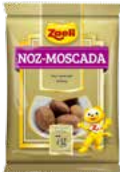
Noz-Moscada Nuez Moscada Nutmeg SAP: 100093 | 20x7g DUN 14: 1 789618390146 9 EAN 13: 789618390146 2 NCM: 0908.11.00