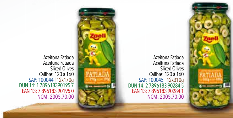
Azeitona Fatiada Aceituna Fatiada Sliced Olives Calibre: 120 à 160 SAP: 100044 | 12x170g DUN 14: 1 789618390195 7 EAN 13: 7 896183 90195 0 NCM: 2005.70.00

O Brasil está entre os 10 maiores consumidores de azeitona do mundo, por isso temos vários sabores e tipos, para que possamos atender todos os gostos.