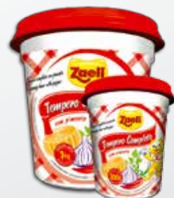
Tempero Completo com Pimenta Sazonador Completo Complete Seasoning With Pepper SAP: 100210 | 24x300g DUN 14: 2 789618390115 2 EAN 13: 7 89618390115 8 SAP: 100211 | 6x1kg DUN 14: 1 789618390206 0 EAN 13: 7 89618390206 3 NCM: 2103.90.21