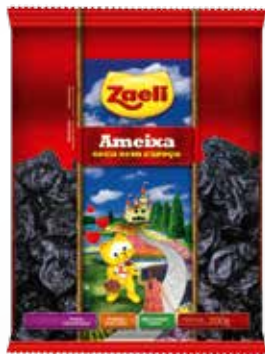
Ameixa Seca sem Carozo Ciruela Seca sin Carozo Pitted Prunes SAP: 101835 | 12x200g DUN 14: 1 789618390873 4 EAN 13: 789618390873 7 NCM: 0813.20.20