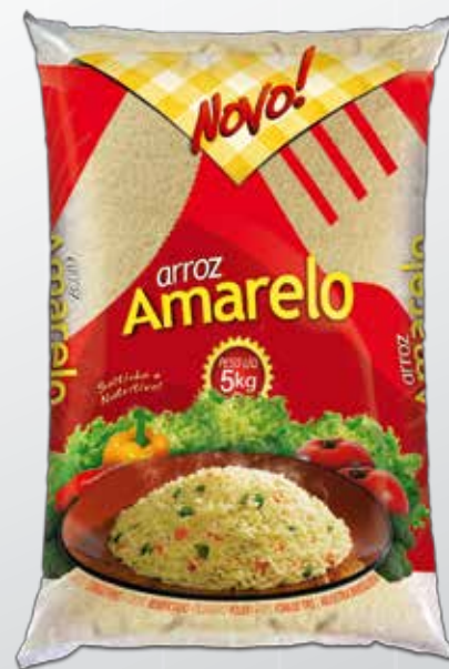
Arroz Amarelo - Fora de Tipo Arroz Amarillo - Fuera de Tipo Yellow Rice - Out Tupe SAP: 100731 | 6x5kg DUN 14: 1 789618390667 9 EAN 13: 7 89618390667 2 SAP: 100255 | 30kg EAN 13: 7 89618390796 9 NCM: 1006.30.21