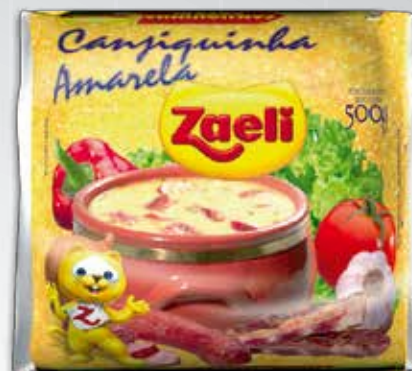
Canjiquinha de Milho Maiz en Granos Maize Gritz SAP: 100112 | 10x500g DUN 14: 1 789618390126 1 EAN 13: 789618390126 4 NCM: 1104.23.00