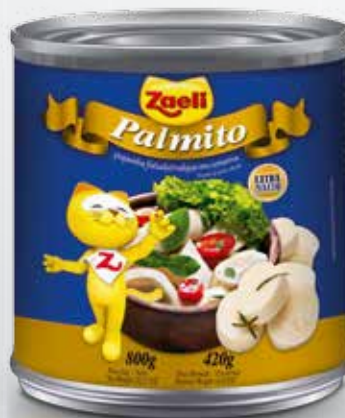
Palmito Fatiado 420g Palmito Fatiado 420g Hearts Of Palm Slice 14,8oz SAP: 102264 | 12x420g DUN 14: 1 789618390902 1 EAN 13: 7 89618390902 4 NCM: 2008.91.00