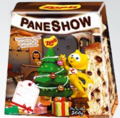
PaneShow PaneShow Panetone With Chocolate Pieces SAP: 100171 | 6x500g DUN 14: 1 789618390612 9 EAN 13: 7 89618390612 2 NCM: 1905.20.10

O panetone é um alimento tradicional da época de Natal. É preparado com produtos de primeiríssima qualidade através da fermentação natural sem a utilização de química. Os componentes são: farinha de trigo, ovos, mel, leite em pó, frutas cristalizadas, uvas passas e essência natural. A exclusiva receita utilizada é originária da Itália, país reconhecido mundialmente como o berço do Panetone. A produção é feita em maquinários modernos e higiênicos. A somatória de todos estes fatores faz com que o Panetone Zaelli seja de qualidade inigualável no mercado, pois apresenta e conserva o sabor, textura, aroma, umidade e maciez de forma única.