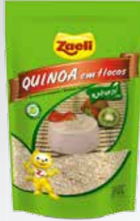
Quinoa Em Flocos Quinoa Flakes Quinoa Flakes SAP: 100751 | 6x250g DUN 14: 1 7896183 90976 2 EAN 13: 7 896183 90976 5 NCM: 1904.90.00