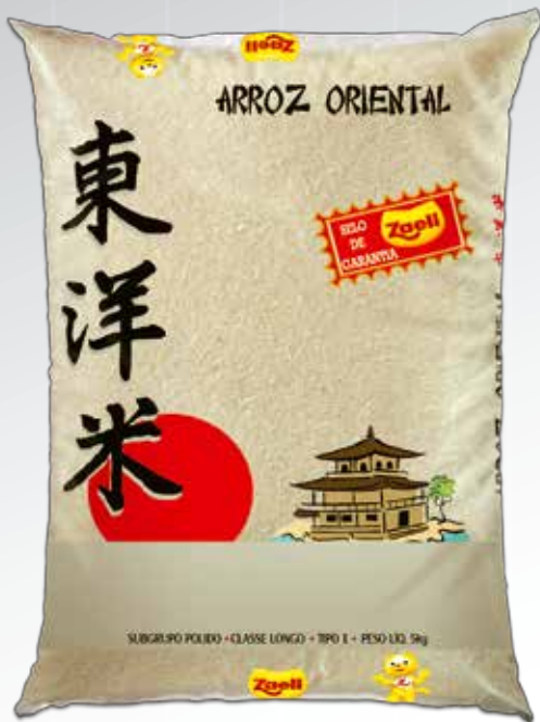
Arroz Oriental - T1 Arroz Oriental - T1 Oriental Rice Type 1 SAP: 102754 | 10x1kg DUN 14: 1 7896183 90154 4 EAN 13: 7 896183 90154 7 SAP: 100020 | 6x5kg DUN 14: 1 789618390080 6 EAN 13: 7 89618390080 9 NCM: 1006.30.21