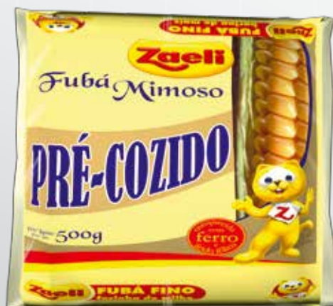
Fubá Pré-Cozido Harina de Maiz Pre-Cocido Pre-Cooked Corn Flour SAP: 100120 | 10x500g DUN 14: 1 789618390626 6 EAN 13: 7 89618390626 9 NCM: 1102.20.00