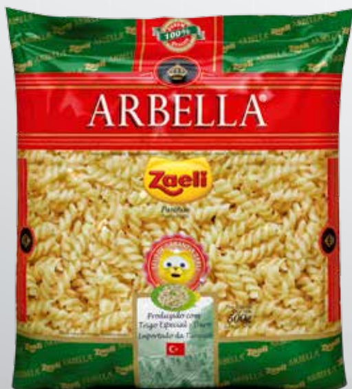
Massa Grano Duro - Parafuso Massa Durum Fusillis Pasta Durum - Fusilli SAP: 101967 | 20x500g DUN 14: 1 789618390877 2 EAN 13: 7 89618390877 5 NCM: 1902.19.00