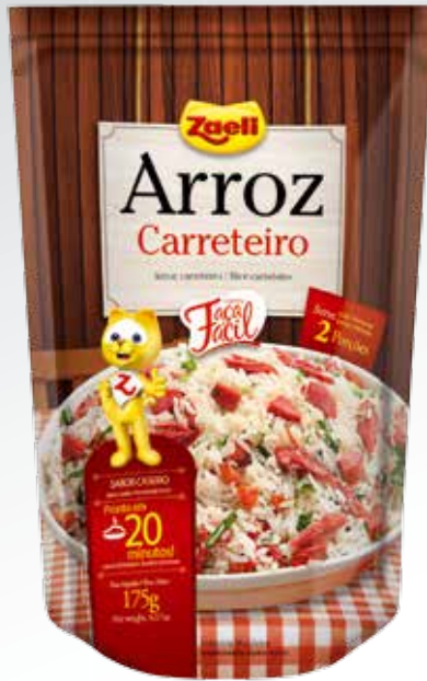
Arroz Carreiro Arroz Carretero Carretero Rice SAP: 102429 | 12x175g DUN 14: 1 789618390918 2 EAN 13: 7 89618390918 5 NCM: 2104.20.00