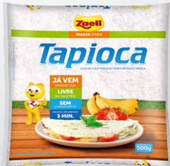
Massa Pronta para Tapioca Masa Lista para "Tapioca" Ready Paste for "Tapioca" SAP: 102704 | 20x500g DUN 14: 1 789618390952 6 EAN 13: 7 89618390952 9 NCM:1903.00.00