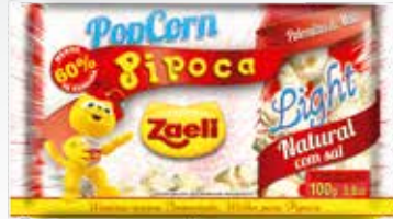
Pipoca para Micro-ondas Natural Light Maiz para Microondas Natural Light Microwave Popcorn - Light Natural Flavor SAP: 100253 | 12x100g DUN 14: 2 789618390391 0 EAN 13: 7 89618390391 6 NCM: 2008.19.00