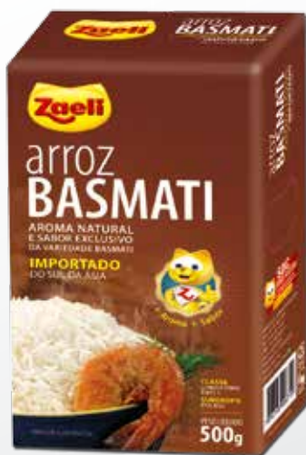
Arroz Basmati - T1 Arroz Basmati - T1 Basmati Rice Type 1 SAP: 100837 | 10x500g DUN 14: 1 789618390671 6 EAN 13: 7 89618390671 9 NCM: 1006.30.21