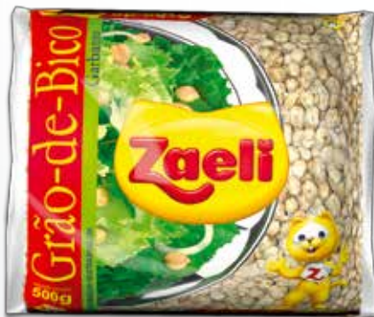
Grão de Bico Garbanzo Chickpea SAP: 100140 | 10x500g DUN 14: 1 789618390147 6 EAN 13: 7 89618390147 9 NCM: 0713.20.90