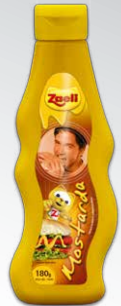
Mostarda Mostaza Mustard

SAP: 102946 | 12x400g DUN 14: 1 789618391007 2 EAN 13: 7 89618391007 5 NCM: 2103.30.21