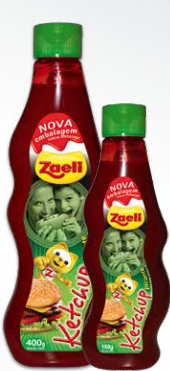
Catchup Picante Catchup Picante Spicy Ketchup

SAP: 101401 | 12x180g DUN 14: 1 7896183 90830 7 EAN 13: 7 896183 90830 0 SAP: 100067 | 12x400g DUN 14: 1 789618390423 1 EAN 13: 7 89618390423 4 NCM: 2103.20.10