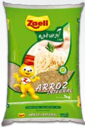
Arroz Integral Arroz Integral Integral Rice SAP: 100138 | 10x1kg DUN 14: 2 789618390481 8 EAN 13: 7 89618390481 4 NCM: 1006.20.20