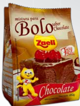
Mistura para Bolo sabor Chocolate Mezcla para Torta sabor Chocolate Cake Mix - Chocolate Flavor SAP: 100155 | 12x450g DUN 14: 1 789618390474 3 EAN 13: 7 89618390474 6 NCM: 1901.20.00