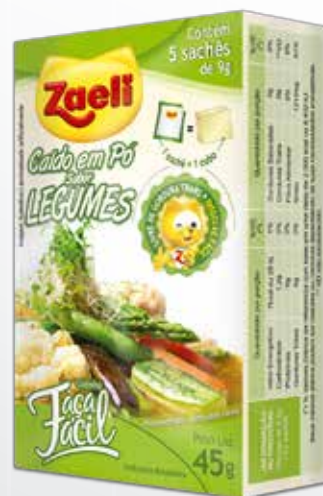
Caldo em Pó Sabor Legumes Caldo en Polvo Sabor Legumbres Powder Seasoning Flavor Vegetables SAP: 100471 | 24x45g DUN 14: 1 789618390647 1 EAN 13: 7 89618390647 4 NCM: 2103.90.21