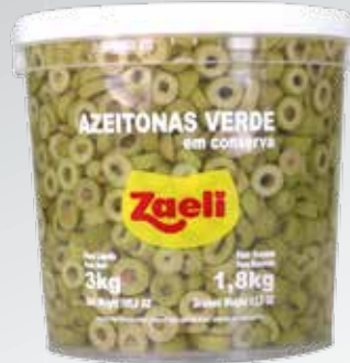
Azeitona Fatiada Aceituna Fatiada Sliced Olives SAP: 101940 | 1,8kg EAN 13: 7 89618390881 2 NCM: 2005.70.00