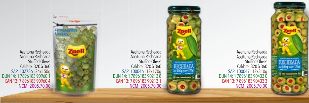
Azeitona Recheada Aceituna Recheada Stuffed Olives Calibre: 320 à 360 SAP: 102736 | 24x150g DUN 14: 1 7896183 90960 1 EAN 13: 7 896183 90960 4 NCM: 2005.70.00