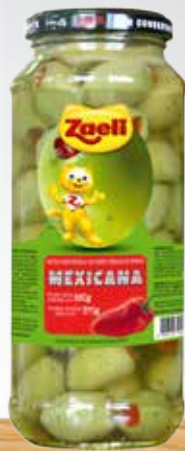
Azeitona Verde Recheada Mexicana Aceituna Recheada Mexicana Stuffed Olive Mexicana SAP: 102742 | 12x370g DUN 14: 1 7896183 90961 8 EAN 13: 7 896183 90961 1 NCM: 2005.70.00