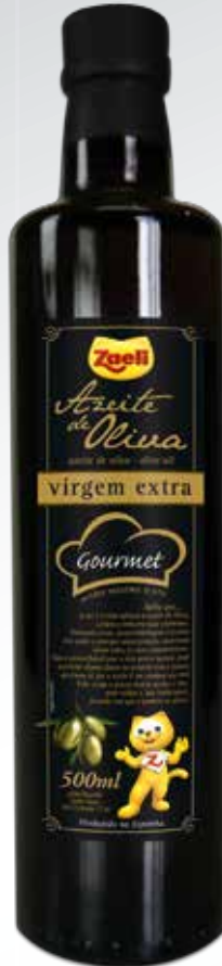
Azeite de Oliva Extra Virgem Gourmet Aceite de Oliva Extra Virgen Gourmet Extra Virgin Olive Oil Gourmet SAP: 100039 | 6x500ml DUN 14: 1 789618390601 3 EAN 13: 7 89618390601 6 NCM: 1509.10.00