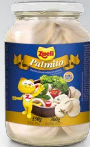
Palmito Fatiado 300g Palmito Fatiado 300g Hearts Of Palm Slice 10,6oz SAP: 102258 | 15x300g DUN 14: 1 789618390900 7 EAN 13: 7 89618390900 0 NCM: 2008.91.00