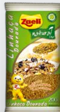
Semente de Linhaca Dourada Semillas de Linaza Dorada Golden Flaxseed SAP: 100836 | 10x200g DUN 14: 1 789618390614 3 EAN 13: 7 89618390614 6 NCM: 1204.00.90