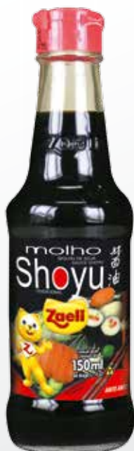
Molho de Soja Shoyu Salsa de Soya Soy Sauce SAP: 100163 | 12x150ml DUN 14: 1 789618390425 5 EAN 13: 7 89618390425 8 NCM: 2103.10.10