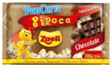
Pipoca para Micro-ondas Chocolate Maiz para Microondas Chocolate Microwave Popcorn - Chocolate Flavor SAP: 100185 | 12x100g DUN 14: 1 789618390584 9 EAN 13: 7 89618390584 2 NCM: 2008.19.00