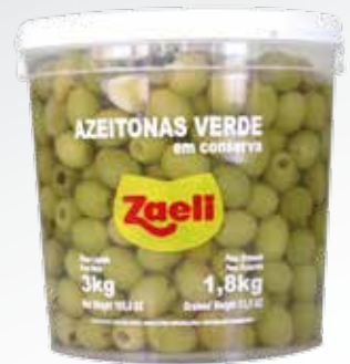
Azeitona Verde sem Carozo Aceituna Verde sen Carozo Pitted Olives SAP: 101946 | 1,8kg EAN 13: 7 89618390883 6 NCM: 2005.70.00