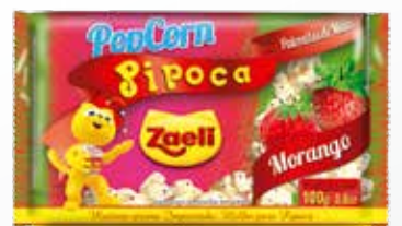
Pipoca para Micro-ondas Morango Maiz para Microondas Fresa Microwave Popcorn - Strawberry Flavor SAP: 100187 | 12x100g DUN 14: 1 789618390586 3 EAN 13: 7 89618390586 6 NCM: 2008.19.00