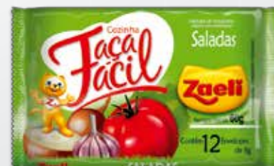
Mistura de Temperos Faça Fácil - Saladas Mezcla de Temperos Faça Fácil - Ensaladas "Faça Fácil" Seasoning - Salads SAP: 100222 | 24x60g DUN 14: 1 789618390537 5 | EAN 13: 7 89618390537 8 NCM: 2103.90.21

O Tempero Faça-Fácil Zaeli é uma deliciosa combinação de temperos na medida certa para dar cor e sabor às refeições do dia-a-dia. Com um toque caseiro, pode ser usado em diferentes pratos para realçar e completar o sabor. É prático e fácil de manusear devido à embalagem ser em sachês com dose diária.