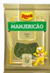
Manjeriço Desidratado Albahaca Deshidratada Dried Basil SAP: 102580 | 20x7g DUN 14: 1 789618390421 2 EAN 13: 7 89618390921 5 NCM: 1211.90.01