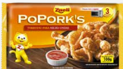
Popporks - Torresmo Micro-ondas 100g SAP: 102807 | 20x100g DUN 14: 1 7896183 90995 3 EAN 13: 7 896183 90995 6 NCM: 0210.19.00