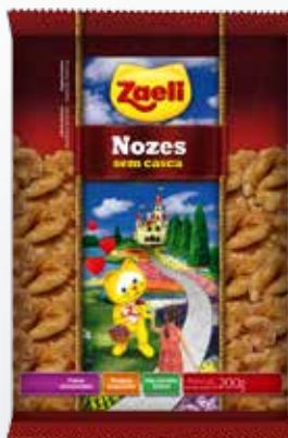
Nozes Nueces Nuts SAP: 100898 | 10x100g DUN 14: 1 789618390664 8 EAN 13: 789618390664 1 NCM: 0802.32.00