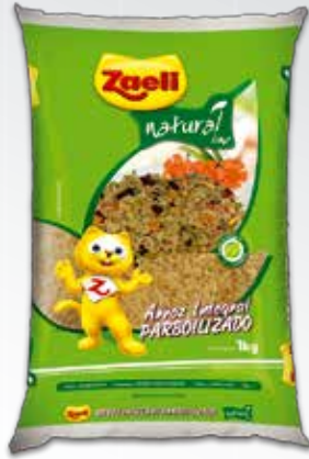
Arroz Integral Parboilizado Arroz Integral Parboilizado Parboiled Brown Rice SAP: 100900 | 10x1kg DUN 14: 1 789618390731 7 EAN 13: 7 89618390731 0 NCM: 1006.30.11