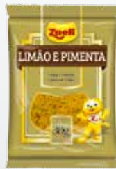
Limão e Pimenta Limon y Pimienta Lemon and Pepper SAP: 102931 | 20x30g DUN 14: 1 789618391005 8 EAN 13: 789618391005 1 NCM: 2103.90.21