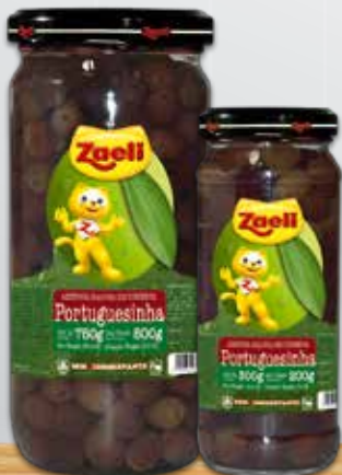
Azeitona Portuguesainha Aceituna Portuguesainha Portuguese Olive SAP: 100668 | 12x200g DUN 14: 1 7896183 90673 0 EAN 13: 7 896183 90673 3 SAP: 100667 | 12x500g DUN 14: 1 7896183 90674 7 EAN 13: 7 896183 90674 0 NCM: 2005.70.00