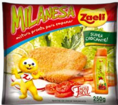
Mistura para Empanar "Milanesa" Mezcla para Empañar "Milanesa" Mix To Coat "Milanesa" SAP: 101435 | 20x250g DUN 14: 1 789618390751 5 EAN 13: 7 89618390751 8 NCM:1905.90.90