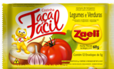
Mistura de Temperos Faça Fácil - Legumes, Verduras e Arroz Mezcla de Temperos Faça Fácil - Hortalizas y arroz "Faça Fácil" Seasoning - Vegetables, Greens and Rice SAP: 100219 | 24x60g DUN 14: 1 789618390324 1 | EAN 13: 7 89618390324 4 NCM: 2103.90.21