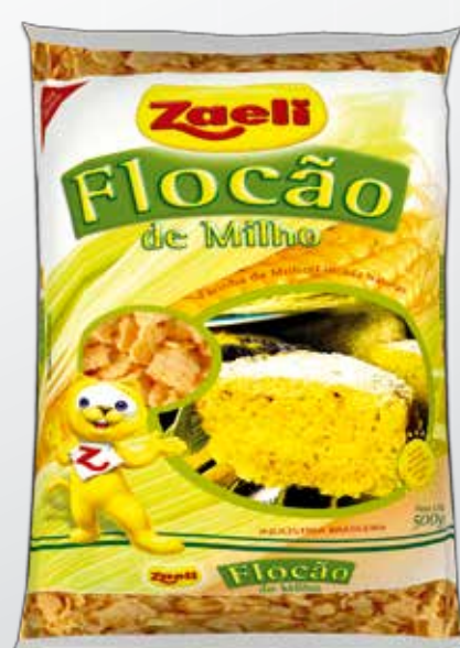
Flocão de Milho Copo de Maíz "Flocão" Corn Flakes SAP: 100117 | 10x500g DUN 14: 1 789618390594 8 EAN 13: 7 89618390594 1 NCM: 1104.19.00