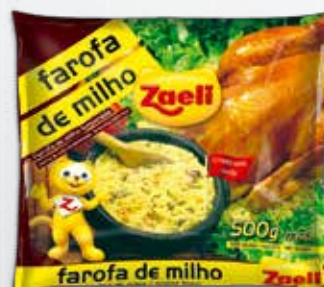
Farofa de Milho Harina de Maiz Condimentada Seasoned Maize Flour SAP: 100110 | 20x500g DUN 14: 1 789618390177 3 EAN 13: 7 89618390177 6 NCM: 1102.20.00