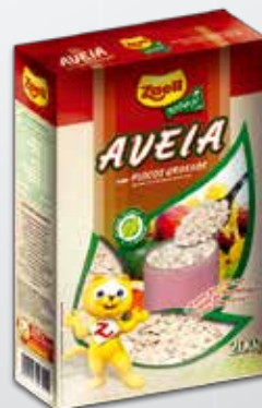
Aveia em Flocos Grossos Avena en Escamas Gruesa Thick Oat Flakes SAP: 101378 | 10x200g DUN 14: 1 789618390721 8 EAN 13: 7 89618390721 1 NCM: 1104.12.00