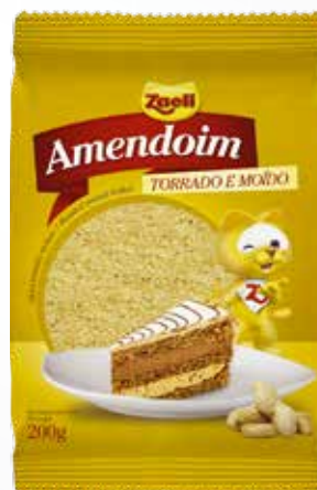
Amendoim Torrado Moído Maní Tostado Molido Roasted Peanut Milled SAP: 102145 | 10x200g DUN 14: 1 789618390859 8 EAN 13: 7 89618390859 1 NCM: 2008.11.00