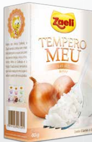
Tempero Meu Sabor Cebola Tempero Mi Cebolla My Seasoning Onion SAP: 101128 | 24x40g DUN 14: 1 789618390749 2 EAN 13: 7 89618390749 5 NCM: 2103.90.21