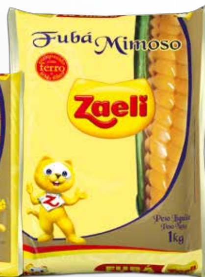
Fubá Mimoso Harina de Maiz "Mimoso" Corn Flour SAP: 100119 | 20x500g DUN 14: 1 789618390028 8 EAN 13: 7 89618390028 1 SAP: 100118 | 20x1kg DUN 14: 1 789618390029 5 EAN 13: 7 89618390029 8 NCM: 1102.20.00