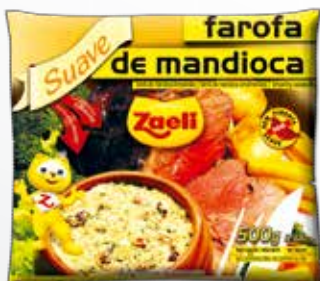
Farofa de Mandioca Suave Harina de Mandioca Condimentada Seasoned Cassava Flour - Mild Flavor SAP: 101267 | 20x500g DUN 14: 1 789618390099 8 EAN 13: 789618390099 1 SAP: 100972 | 20x250g DUN 14: 1 789618390770 6 EAN 13: 789618390770 9 NCM: 1106.20.00