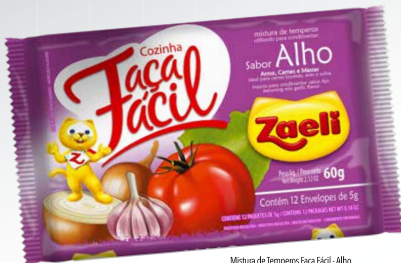
Mistura de Temperos Faça Fácil - Alho Mezcla de Temperos Faça Fácil - Ajo "Faça Fácil" Seasoning - Garlic SAP: 102776 | 24x60g DUN 14: 1 7896183 90992 2 | EAN 13: 7 896183 90992 5 NCM: 2103.90.21