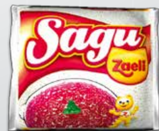
Sagu Sagu Sago SAP: 100207 | 10x500g DUN 14: 1 789618390053 0 EAN 13: 7 89618390053 3 NCM: 1106.20.00