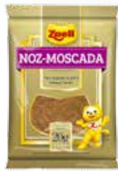
Noz-Moscada em Pó Nuez Moscada en Polvo Powdered Nutmeg SAP: 100094 | 20x20g DUN 14: 1 789618390416 3 EAN 13: 7 89618390416 6 NCM: 0908.12.00