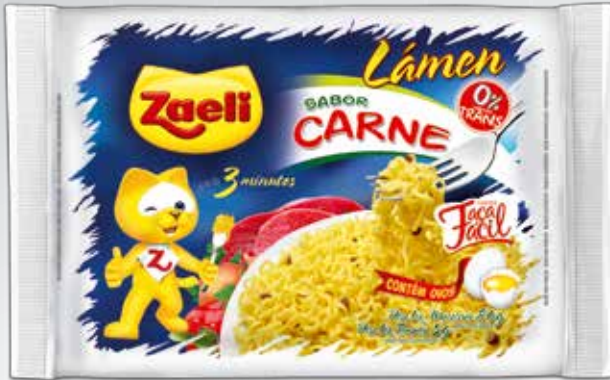
Macarrão Instantâneo Carne Macarrão Instantaneo Carne Instant Noodles - Meat Flavor SAP: 102221 | 50x85g DUN 14: 2 789618390572 3 EAN 13: 7 89618390572 9 NCM: 1902.30.00