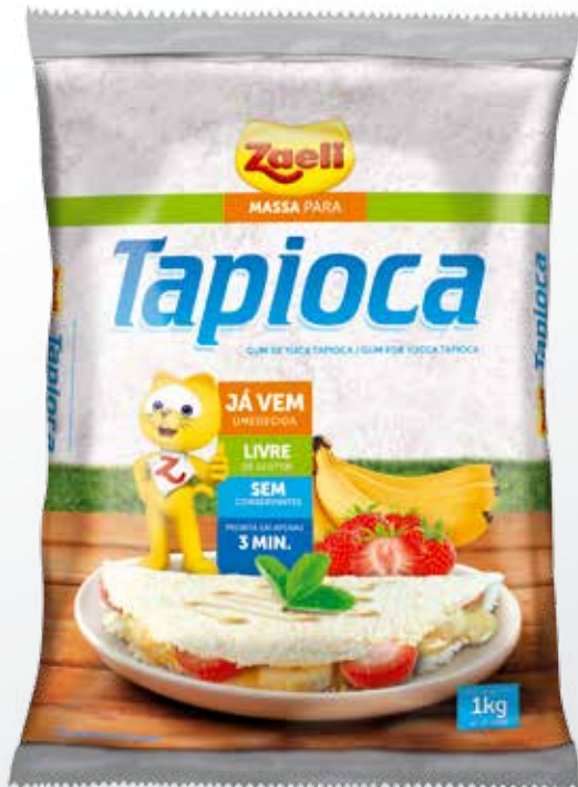
Massa Pronta para Tapioca Masa Lista para "Tapioca" Ready Paste for "Tapioca" SAP: 102702 | 10x1Kg DUN 14: 1 789618390953 3 EAN 13: 7 89618390953 6 NCM:1903.00.00