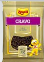
Cravo Cravo de Olor Clove SAP: 100089 | 20x7g DUN 14: 1 789618390104 9 EAN 13: 7 89618390104 2 NCM: 0907.10.00