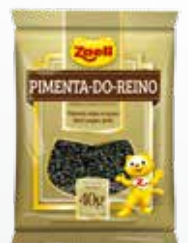
Pimenta-do-Reino em grão Pimienta Negra Black Pepper Seeds SAP: 100096 | 20x40g DUN 14: 2 789618390106 0 EAN 13: 789618390106 6 NCM: 0904.11.00