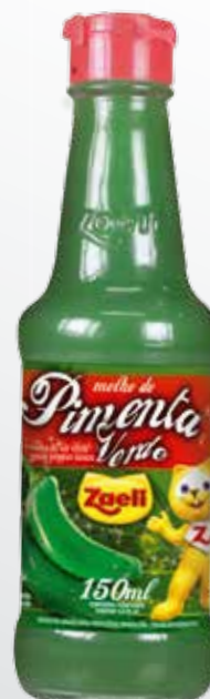
Molho de Pimenta Verde Salsa de Pimenta Verde Green Pepper Sauce

SAP: 100164 | 12x150ml DUN 14: 1 789618390135 3 EAN 13: 7 89618390135 6 NCM: 2103.90.21