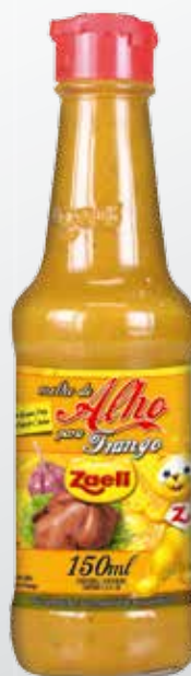
Molho de Alho p/ Frango Salsa de Ajo p/ Pollo Garlic Sauce for Chicken SAP: 101999 | 12x150ml DUN 14: 1 789618390887 1 EAN 13: 7 89618390887 4 NCM: 2103.90.21