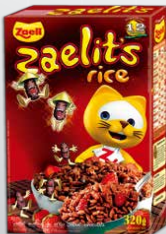
Cereal Matinal Rice com Chocolate (arroz) Cereal Matinal Rice con Chocolate Rice Cereal With Chocolate SAP: 100073 | 6x320g DUN 14: 2 789618390611 9 EAN 13: 7 89618390611 5 NCM: 1904.10.00