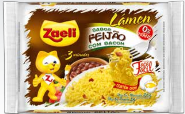
Macarrão Instantâneo Feijão com Bacon Macarrão Instantaneo Poroto com Bacon Instant Noodles - Beans with Bacon Flavor SAP: 102224 | 50x85g DUN 14: 2 789618390569 3 EAN 13: 7 89618390569 9 NCM: 1902.30.00