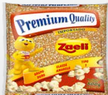
Pipoca Americana Premium Quality Pororó Americano Premium Quality American Premium Quality Popcorn SAP: 102288 | 20x500g DUN 14: 1 789618390039 4 EAN 13: 7 89618390039 7 NCM: 1005.90.10

As pipocas Zaeli são classificadas e empacotadas somente aquelas que apresentarem expansão mínima de 38 cm 3 , pois desta forma atingirá, após o estouro, um percentual de aproveitamento próximo dos 100%. A matéria-prima passa pelo teste de aflatoxina, e somente na ausência deste, a pipoca é internalizada e processada.