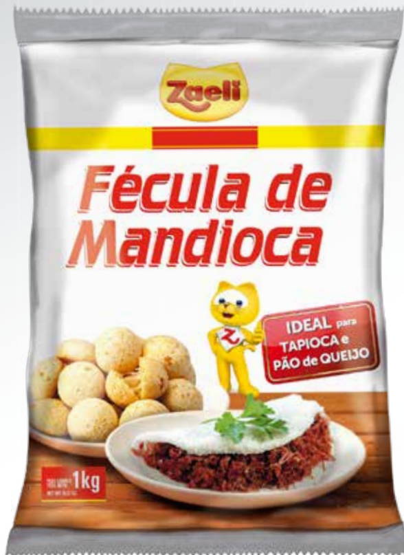
Fécula de Mandioca Fécula de Madioca Cassava starch SAP: 102753 | 10x1Kg DUN 14: 1 7896183 90990 8 EAN 13: 7 896183 90990 1 NCM:1108.14.00