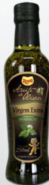
Az. Ext. Vir. Sabor Manjeriçao Aceite Oliva Ext. Vir. Albahaca Ext. Vir. Olive Oil Basil SAP: 100863 | 6x250ml DUN 14: 1 789618390717 1 EAN 13: 7 89618390717 4 NCM: 1509.10.00