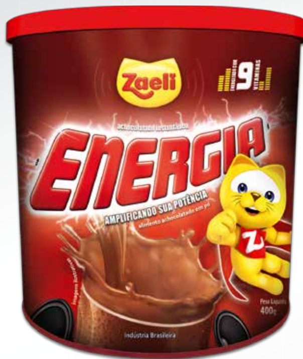
Achocolatado Energia Achocolatado Energia "Energia" Powdered Chocolate SAP: 101274 | 12x400g DUN 14: 2 789618390469 6 EAN 13: 7 89618390469 2 NCM: 1806.90.00

O Achocolatado Energia é enriquecido com 9 vitaminas e a porcentagem destas vitaminas no produto é o nosso diferencial. A composição do produto é realizada com as proporções devidas para uma excelente dissolução. Utiliza uma maior quantidade de lecitina de soja, que encarece o produto, mas garante uma excelente dissolução quando misturado ao leite. Também se utiliza alta porcentagem de cacau alcalino garantindo mais cor e sabor de chocolate. Outro grande diferencial do Achocolatado Energia é que não utilizamos nenhum tipo de corante, o que o diferencia dos demais achocolatados do mercado, resultando em mais sabor e cor inigualável.