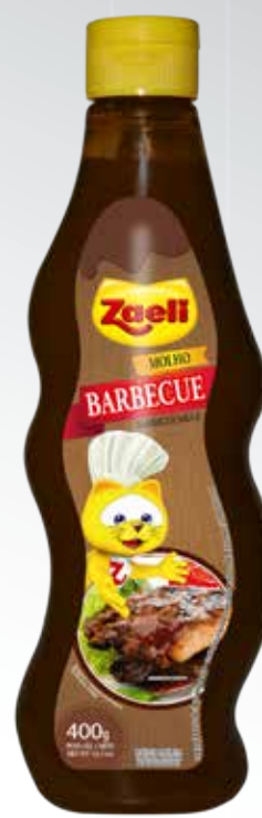
Barbecue / Barbecue Barbecue Sauce

SAP: 100069 | 12x180g DUN 14: 1 789618390518 4 EAN 13: 7 89618390518 7 SAP: 100066 | 12x400g DUN 14: 1 789618390184 1 EAN 13: 7 89618390184 4 NCM: 2103.20.10