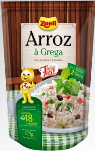
Arroz à Grega Arroz a la Griega Greek Rice SAP: 102427 | 12x175g DUN 14: 1 789618390917 5 EAN 13: 7 89618390917 8 NCM: 2104.20.00