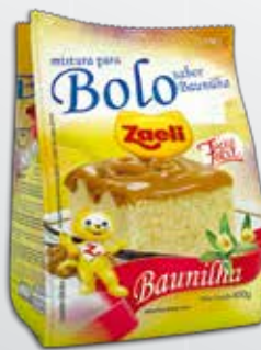
Mistura para Bolo sabor Baunilha Mezcla para Torta sabor Vainilla Cake Mix - Vanilla Flavor SAP: 100154 | 12x450g DUN 14: 1 789618390475 0 EAN 13: 7 89618390475 3 NCM: 1901.20.00