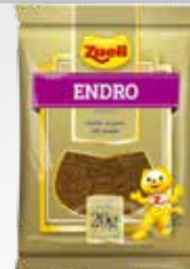
Endro em Pó Eneldo en Polvo Dill Powder SAP: 100101 | 20x20g DUN 14: 1 789618390419 4 EAN 13: 7 89618390419 7 NCM: 0909.62.90