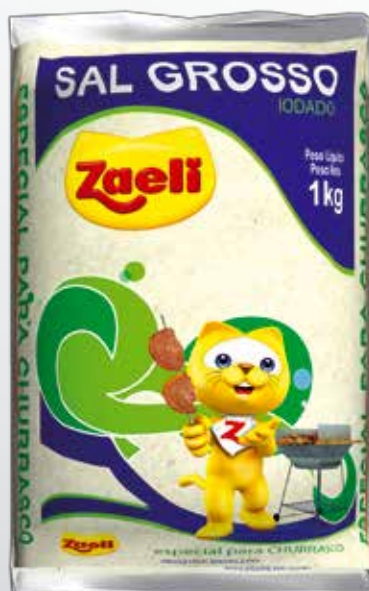
Sal Grosso Sal Gruesa Coarse Salt SAP: 100203 | 30x1kg DUN 14: 2 789618390226 5 EAN 13: 7 89618390226 1 NCM: 2501.00.20