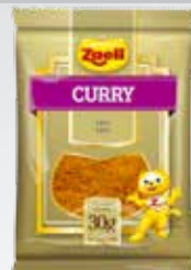
Curry Curry en polvo Curry Powder SAP: 102585 | 20x30g DUN 14: 1 789618390923 6 EAN 13: 7 89618390923 9 NCM: 0910.99.00