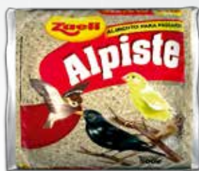
Alpiste Alpiste Birdseeds SAP: 100175 | 10x500g DUN 14: 2 789618390061 2 EAN 13: 7 89618390061 8 NCM: 1008.30.90