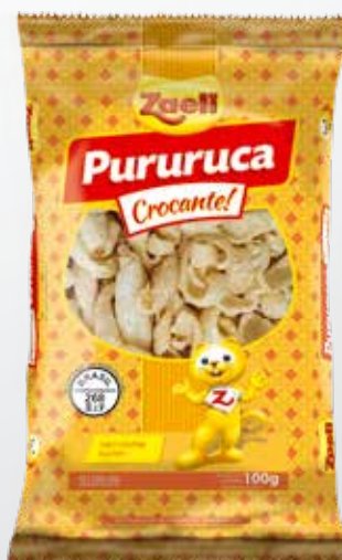
Pururuca Crocante 100g SAP: 102809 | 10x100g DUN 14: 1 7896183 90993 9 EAN 13: 7 896183 90993 2 NCM: 0210.19.00