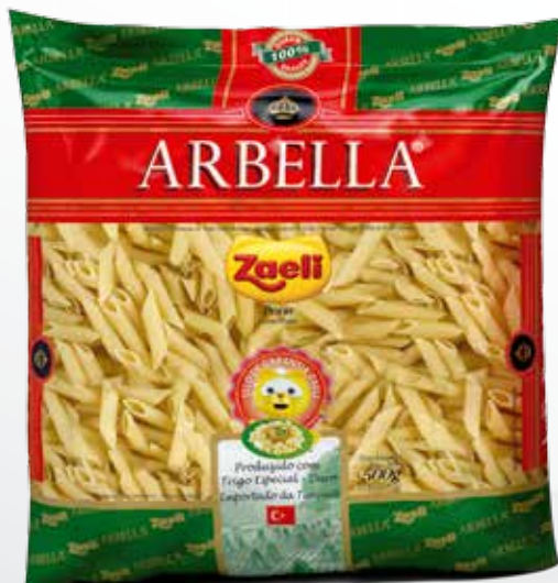
Massa Grano Duro - Penne Massa Durum - Penne Pasta Durum - Penne SAP: 101968 | 20x500g DUN 14: 1 789618390875 8 EAN 13: 7 89618390875 1 NCM: 1902.19.00

Fabricadas na Turquia, as pastas Arbella são exportadas para 90 países e fazem sucesso, inclusive, na Itália, país onde se encontram os paladares mais exigentes quando o assunto é macarrão! Toda esta qualidade e sucesso agora chegam ao Brasil, com a certeza de que irão agradar aos paladares mais sofisticados, afinal, merecemos comer bem.