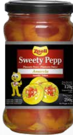
Sweety Pepp Amarelo Sweety Pepp Amarillo Sweety Pepp Yellow SAP: 102733 | 12x290g DUN 14: 1 7896183 90975 5 EAN 13: 7 896183 90975 8 NCM: 2001.90.00