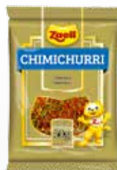
Chimichurri Chimichurri Chimichurri SAP: 102929 | 20x50g DUN 14: 1 789618391004 1 EAN 13: 7 89618391004 4 NCM: 2103.90.21