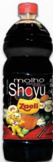
Molho de Soja Shoyu 900ml Salsa de Soya 900ml Soy Sauce SAP: 100168 | 6x900ml DUN 14: 1 789618390414 9 EAN 13: 7 89618390414 2 NCM: 2103.10.10