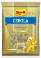
Cebola em Flocos Cebolla en Escamas Onion Flakes SAP: 100087 | 20x40g DUN 14: 1 789618390293 0 EAN 13: 7 89618390293 3 NCM: 0712.20.00