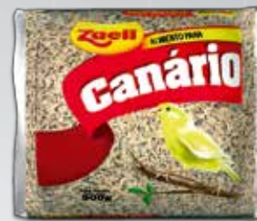
Alimento para Canário Alimento para canário Bird Feed for "Canary" SAP: 100180 | 10x500g DUN 14: 1 789618390138 4 EAN 13: 7 89618390138 7 NCM: 1008.90.90