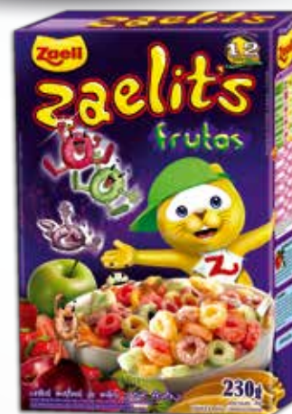
Cereal Matinal Frutas Cereal Matinal Frutas Fruit Cereal SAP: 100071 | 6x230g DUN 14: 2 789618390610 2 EAN 13: 7 89618390610 8 NCM: 1904.10.00

Os cereais matinais Zaeli são enriquecidos com 12 nutrientes (8 vitaminas e 4 minerais), obtidos a partir de 5 tipos de farinhas de cereais: Arroz, Aveia, Soja, Milho e Trigo. O processo produtivo de última geração totalmente automatizado e contínuo faz com que o produto processado seja sempre uniforme, higiênico e sem variações. Essas características e a utilização da soja os diferenciam dos demais do mercado.