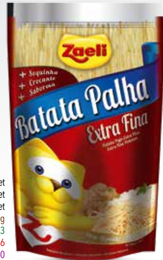
Batata Palha Extrafina Pouchet Patata Paja Extra-fina Pouchet Straw Potato Extra-fine Pouchet SAP: 102701 | 20x140g DUN 14: 1 789618390841 3 EAN 13: 7 89618390841 6 NCM: 2005.20.00