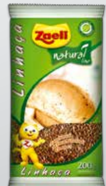
Semente de Linhaca Marrom Semillas de Linaza Marrom Brown Flaxseed SAP: 100139 | 10x200g DUN 14: 1 789618390534 4 EAN 13: 7 89618390534 7 NCM: 1204.00.90