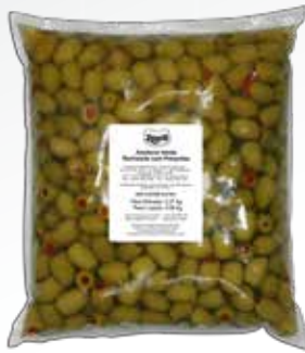
Azeitona Recheada com Pimentão Aceituna Recheada con Pimentón Stuffed Olives with Pepper SAP: 102707 | 2x2,27kg DUN 14: 1 789618390951 9 EAN 13: 7 89618390951 2 NCM: 2005.70.00