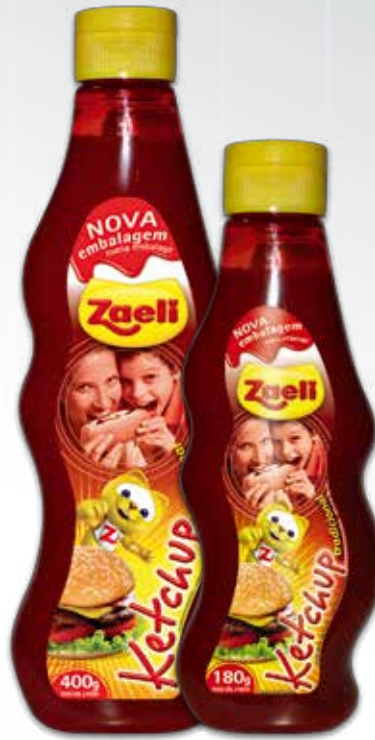
Catchup Catchup Ketchup

SAP: 101401 | 12x180g DUN 14: 1 7896183 90830 7 EAN 13: 7 896183 90830 0 SAP: 100067 | 12x400g DUN 14: 1 789618390423 1 EAN 13: 7 89618390423 4 NCM: 2103.20.10