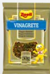
Vinagrete Vinagrete Vinagrete SAP: 102930 | 20x50g DUN 14: 1 789618391006 5 EAN 13: 789618391006 8 NCM: 2103.90.29