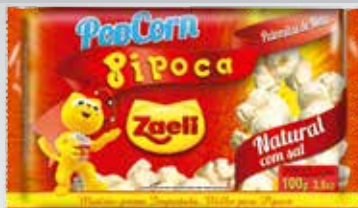
Pipoca para Micro-ondas Natural Maiz para Microondas Natural Microwave Popcorn - Natural Flavor SAP: 100193 | 24x100g DUN 14: 1 789618390171 1 EAN 13: 7 89618390171 4 NCM: 2008.19.00