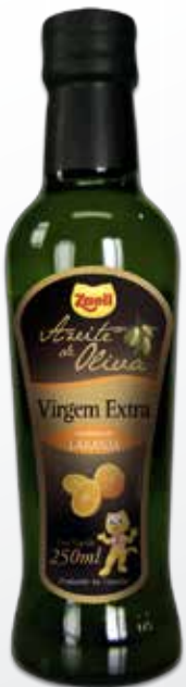
Az. Ext. Vir. Sabor Laranja Aceite Oliva Ext. Vir. Naranja Ext. Vir. Olive Oil Orange SAP: 101200 | 6x250ml DUN 14: 1 789618390795 9 EAN 13: 7 89618390795 2 NCM: 1509.10.00