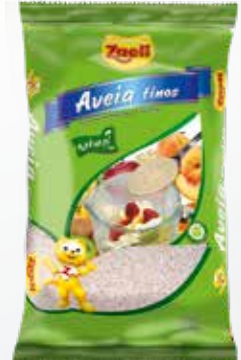
Aveia em Flocos Finos Avena en Escamas Finos Fine Oat Flakes SAP: 102970 | 12x400g DUN 14: 1 7896183 91013 3 EAN 13: 7 896183 91013 6 NCM: 1104.12.00