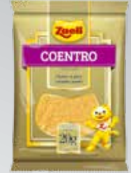
Coentro em Pó Cilantro en Polvo Coriander Powder SAP: 100100 | 20x20g DUN 14: 1 789618390418 7 EAN 13: 7 89618390418 0 NCM: 0909.22.00