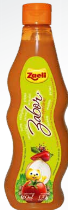
Zabor Salsa Zabor Zabor Sauce SAP: 100729 | 12x150ml DUN 14: 1 789618390669 3 EAN 13: 7 89618390669 6 NCM: 2103.90.21