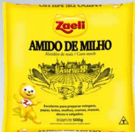
Amido de Milho 500g Almidón del Maíz Corn Starch SAP: 101398 | 20x500g DUN 14: 1 789618390826 0 EAN 13: 7 89618390826 3 NCM: 1108.12.00