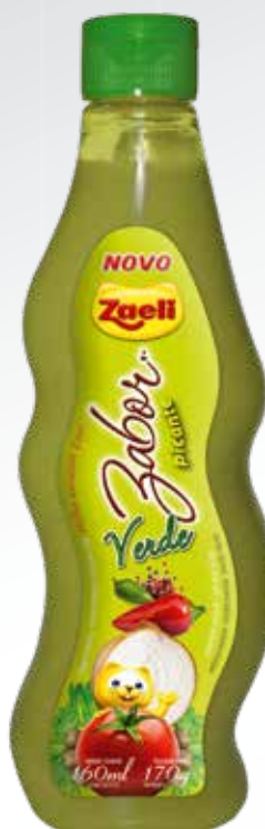
Zabor Verde Salsa Verde Zabor Zabor Green Sauce SAP: 101518 | 12x160ml DUN 14: 1 789618390867 3 EAN 13: 7 89618390867 6 NCM: 2103.90.21