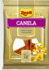
Canela em Casca Canela en cáscara Cinnamon Stick SAP: 100085 | 20x7g DUN 14: 1 789618390092 9 EAN 13: 7 89618390092 2 NCM: 0906.11.00