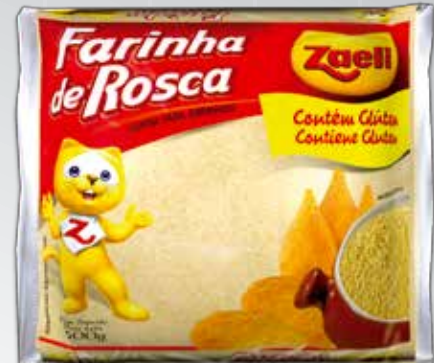
Farinha de Rosca Harina de Pan Tostada Crumbed Flour SAP: 100121 | 10x500g DUN 14: 1 789618390052 3 EAN 13: 7 89618390052 6 NCM:1905.90.90