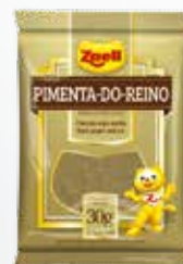
Pimenta-do-Reino Moída Pimenta Molida Ground Black Pepper SAP: 100097 | 20x30g DUN 14: 1 789618390280 0 EAN 13: 789618390280 3 NCM: 0904.12.00