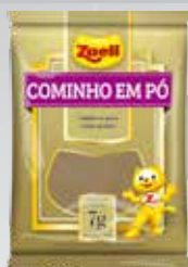
Cominho em Pó Comino en Polvo Ground Cumin SAP: 100318 | 20x7g DUN 14: 1 789618390098 1 EAN 13: 7 89618390098 4 NCM: 0909.30.00