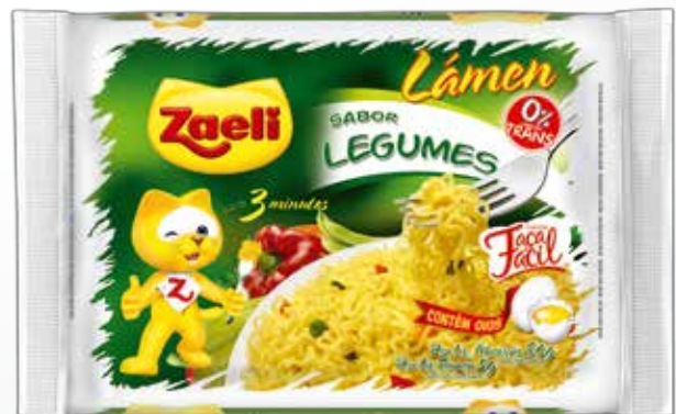
Macarrão Instantâneo Legumes Macarrão Instantaneo Vegetales Instant Noodles - Vegetables Flavor SAP: 102225 | 50x85g DUN 14: 2 789618390570 9 EAN 13: 7 89618390570 5 NCM: 1902.30.00