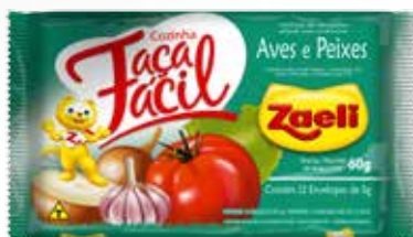
Mistura de Temperos Faça Fácil - Aves, Peixes e Arroz Mezcla de Temperos Faça Fácil - Gallina, Pez y Arroz "Faça Fácil" Seasoning - Birds, Fishies and Rice SAP: 100221 | 24x60g DUN 14: 1 789618390325 8 | EAN 13: 789618390325 1 NCM: 2103.90.21