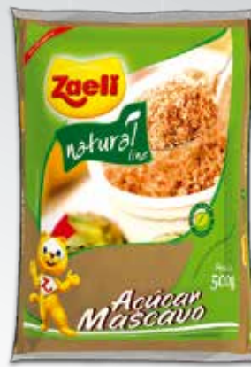
Açúcar Mascavo Azúcar Mascabalo Brown Sugar SAP: 100199 | 10x500g DUN 14: 1 789618390473 6 EAN 13: 7 89618390473 9 NCM: 1701.14.00