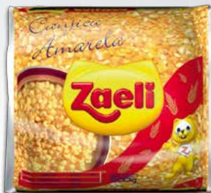
Canjica Amarela Maiz Amarilla Yellow Hominy SAP: 100111 | 10x500g DUN 14: 2 789618390125 1 EAN 13: 7 89618390125 7 NCM: 1104.23.00