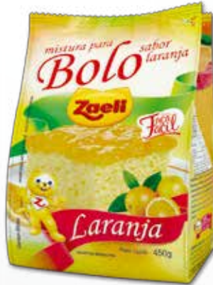
Mistura para Bolo sabor Laranja Mezcla para Torta sabor Naranja Cake Mix - Orange Flavor SAP: 100159 | 12x450g DUN 14: 1 789618390477 4 EAN 13: 7 89618390477 7 NCM: 1901.20.00