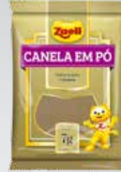
Canela em Pó Canela en Polvo Powder Cinnamon SAP: 100086 | 20x7g DUN 14: 1 789618390093 6 EAN 13: 7 89618390093 9 NCM: 0906.20.00