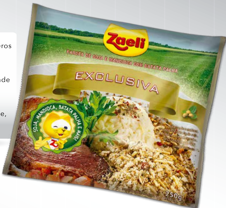
Farofa de Soja com Mandioca e Batata Palha Farofa de Soja con Mandioca y Patata Paja Soy Farofa With Cassava an Potato Sticks SAP: 100881 | 20x250g DUN 14: 1 789618390738 6 EAN 13: 7 89618390738 9 NCM: 1106.20.00

Não existem produtos à altura no mercado quanto à qualidade, higiene e sabor.