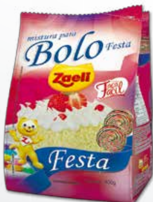
Mistura para Bolo sabor Festa Mezcla para Torta sabor Fiesta Cake Mix - Party Flavor SAP: 100157 | 12x450g DUN 14: 1 789618390502 3 EAN 13: 7 89618390502 6 NCM: 1901.20.00