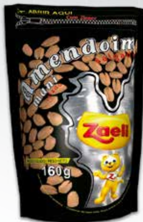
Amendoim Salgado sem Pele Maní Salado sin Piel Salty Peanut SAP: 100008 | 12x160g DUN 14: 1 789618390216 9 EAN 13: 7 89618390216 2 NCM: 2008.11.00

Zeeli os grãos são de tamanhos expressivo por se tratar do produto conhecido como "amendoim cavalo". A embalagem foi especificamente desenvolvida para manter a característica crocante do produto. O acréscimo equilibrado do glutamato monossódico e do sal faz com que o produto apresente um sabor incomparável.