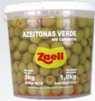
Azeitona Recheada Aceituna Recheada Stuffed Olives SAP: 101944 | 1,8kg EAN 13: 7 89618390882 9 NCM: 2005.70.00