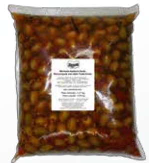
Azeitona Marinado com Ajís Tradicionais Aceituna Marinado en Ajís Tradicionales Marinated Olives with Traditional Aji SAP: 102709 | 2x2,27kg DUN 14: 1 789618390950 2 EAN 13: 7 89618390950 5 NCM: 2005.70.00