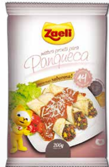
Mistura para Panqueca Mezcla para Crepe Pancake Mix SAP: 101245 | 10x200g DUN 14: 1 789618390735 5 EAN 13: 7 89618390735 8 NCM:1901.90.90