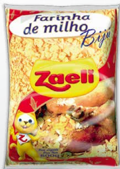
Farinha de Milho (Biju) Harina de Maíz Corn Flour - "Biju" SAP: 100114 | 20x500g DUN 14: 1 789618390086 8 EAN 13: 7 89618390086 1 SAP: 100113 | 20x1kg DUN 14: 1 789618390087 5 EAN 13: 7 89618390087 8 NCM: 1102.20.00