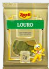
Louro Laurel Bay Leaves SAP: 100091 | 20x7g DUN 14: 1 789618390102 5 EAN 13: 7 89618390102 8 NCM: 0910.99.00