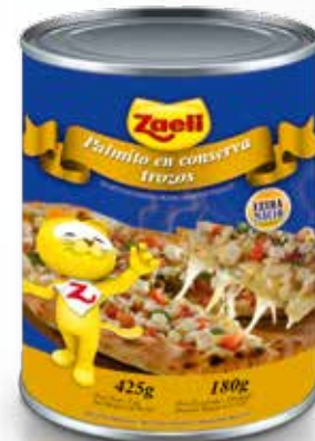
Palmito Picado 180g Palmito Picado 180g Hearts Of Palm Cuts 6,3oz SAP: 102309 | 20x180g DUN 14: 1 789618390903 8 EAN 13: 7 89618390903 1 NCM: 2008.91.00