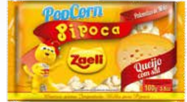
Pipoca para Micro-ondas Queijo Maiz para Microondas Queso Microwave Popcorn - Cheese Flavor SAP: 100194 | 24x100g DUN 14: 2 789618390302 6 EAN 13: 7 89618390302 2 NCM: 2008.19.00