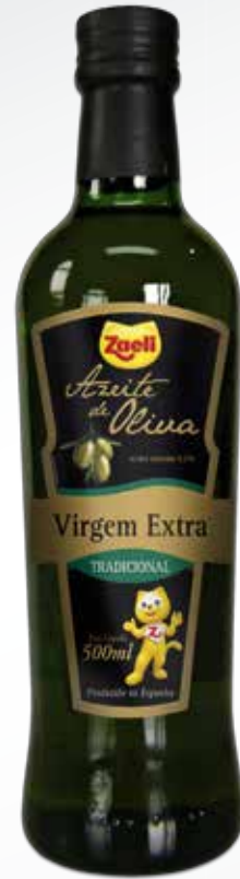
Azeite de Oliva Extra Virgem Tradicional Aceite de Oliva Extra Virgen Tradicional Extra Virgin Olive Oil Traditional SAP: 100862 | 6x500ml DUN 14: 1 789618390716 4 EAN 13: 7 89618390716 7 NCM: 1509.10.00