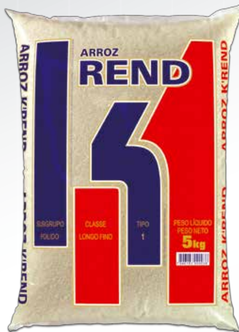
Arroz K'Rend Branco - T1 Arroz K'Rend Blanco - T1 "K'Rend" White Rice Type 1 SAP: 100021 | 30x1kg DUN 14: 1 789618390148 3 EAN 13: 7 89618390148 6 SAP: 100022 | 6x5kg DUN 14: 1 789618390003 5 EAN 13: 7 89618390003 8 NCM: 1006.30.21