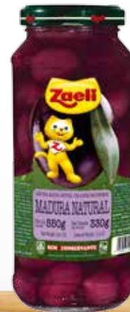
Azeitona Madura Natural Aceituna Madura Natural Natural Ripe Olives SAP: 102745 | 12x330g DUN 14: 1 7896183 90954 0 EAN 13: 7 896183 90954 3 NCM: 2005.70.00