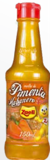
Molho de Pimenta Habanero Salsa de Pimenta Habanero Habanero Pepper Sauce

SAP: 101997 | 12x150ml DUN 14: 1 789618390888 8 EAN 13: 7 89618390888 1 NCM: 2103.90.21