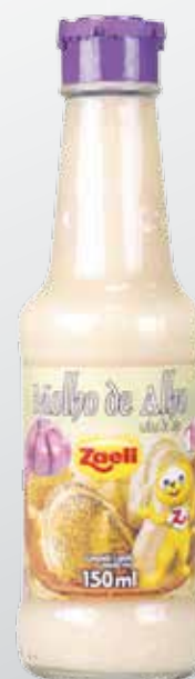
Molho de Alho Salsa de Ajo Garlic Sauce SAP: 100167 | 12x150ml DUN 14: 1 789618390310 4 EAN 13: 7 89618390310 7 NCM: 2103.90.21