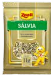
Salvia Desidratada Salvia Desidratada Dried Sage SAP: 100104 | 20x11g DUN 14: 1 789618390421 7 EAN 13: 7 89618390421 0 NCM: 0910.99.00