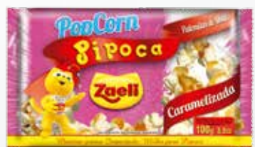
Pipoca para Micro-ondas Doce Maiz para Microondas Dulce Sweet Microwave Popcorn SAP: 100251 | 12x100g DUN 14: 2 789618390390 3 EAN 13: 7 89618390390 9 NCM: 2008.19.00

As pipocas Zaeli são classificadas e empacotadas somente aquelas que apresentarem expansão mínima de 38 cm 3 , pois desta forma atingirá, após o estouro, um percentual de aproveitamento próximo dos 100%. A matéria-prima passa pelo teste de aflatoxina, e somente na ausência deste, a pipoca é internalizada e processada.