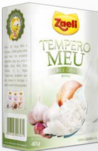
Tempero Meu Sabor Alho e Cebola Tempero Mi Ajo y Cebolla My Seasoning Garlic and Onion SAP: 101131 | 24x40g DUN 14: 1 789618390747 8 EAN 13: 7 89618390747 1 NCM: 2103.90.21