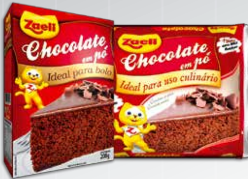
Chocolate em Pó | Chocolate en Polvo | Chocolate Powder SAP: 100077 | 12x200g Cx DUN 14: 1 789618390081 3 | EAN 13: 7 89618390081 6 SAP: 100078 | 12x500g Cx DUN 14: 1 789618390057 8 | EAN 13: 7 89618390057 1 SAP: 101829 | 20x500g Sachê DUN 14: 2 789618390109 1 | EAN 13: 7 89618390109 7 SAP: 100079 | 5kg EAN 13: 7 89618390225 4 NCM: 1806.90.00