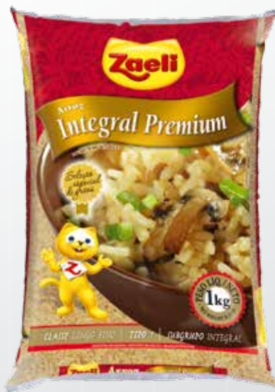
Arroz Integral Premium Quality - T1 Arroz Integral Premium Quality - T1 "Premium Quality" Rice Type 1 SAP: 101538 | 10x1kg DUN 14: 1 789618390850 5 EAN 13: 7 89618390850 8 NCM: 1006.20.20