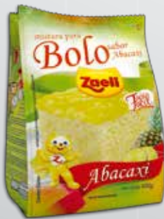
Mistura para Bolo sabor Abacaxi Mezcla para Torta sabor Pinã Cake Mix - Pineapple Flavor SAP: 100152 | 12x450g DUN 14: 1 789618390503 0 EAN 13: 7 89618390503 3 NCM: 1901.20.00