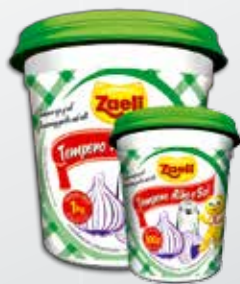
Tempero Alho e Sal Sazonador Ajo y Sal Seasoning - Garlic and Salt SAP: 100212 | 24x300g DUN 14: 2 789618390117 6 EAN 13: 7 89618390117 2 SAP: 100213 | 6x1kg DUN 14: 1 789618390208 4 EAN 13: 7 89618390208 7 NCM: 2103.90.21