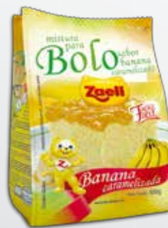
Mistura p/ Bolo sabor Banana Caramelizada Mezcla p/ Torta sabor Banana Caramelizada Cake Mix - Caramelized Banana Flavor SAP: 100153 | 12x450g DUN 14: 1 789618390501 6 EAN 13: 7 89618390501 9 NCM: 1901.20.00