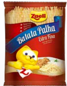
Batata Palha Premium Extrafina Patata Paja Premium Extra-fina Straw Potato Premium Extra-fine SAP: 101189 | 24x80g DUN 14: 1 789618390733 1 EAN 13: 7 89618390733 4 NCM: 2005.20.00