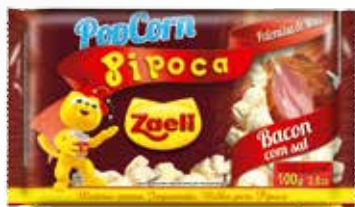
Pipoca para Micro-ondas Bacon Maiz para Microondas Bacon Microwave Popcorn - Bacon Flavor SAP: 100188 | 24x100g DUN 14: 2 789618390303 3 EAN 13: 7 89618390303 9 NCM: 2008.19.00