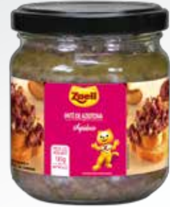
Patê de Azeitona Verde Agri doce Patê de Aceituna Verde Agri dulce Green Olive Pate Bittersweet SAP: 102711 | 12x185g DUN 14: 1 789618390930 4 EAN 13: 7 89618390930 7 NCM: 2104.20.00