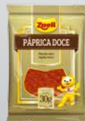
Páprica Doce Paprika Dulce Sweet Paprika SAP: 102569 | 20x30g DUN 14: 1 789618390928 1 EAN 13: 789618390928 4 NCM: 0904.22.00