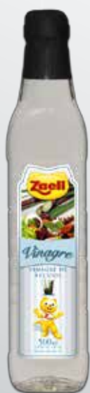
Vinagre de Alcool Vinagre de Alcohol Alcohol Vinegar SAP: 100224 | 12x500ml DUN 14: 1 789618390352 4 EAN 13: 7 89618390352 7 NCM: 2209.00.00