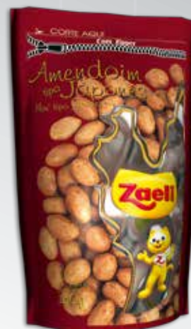
Amendoim Japonês Maní Japonés Japanese Peanut SAP: 100009 | 12x150g DUN 14: 1 789618390114 8 EAN 13: 7 89618390114 1 NCM: 2008.11.00