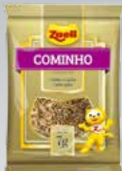
Cominho Comino en Granos Cumin Grains SAP: 100317 | 20x7g DUN 14: 1 789618390097 4 EAN 13: 7 89618390097 7 NCM: 0909.30.00