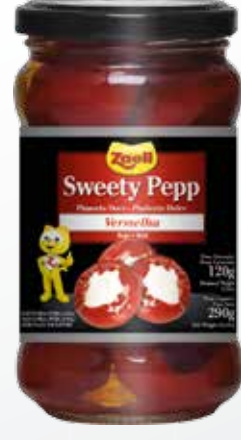
Sweety Pepp Vermelha Sweety Pepp Rojo Sweety pepp Red SAP: 102755 | 12x290g DUN 14: 1 7896183 90974 8 EAN 13: 7 896183 90974 1 NCM: 2001.90.00