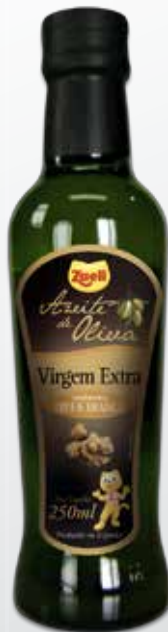
Az. Ext. Vir. Sabor Trufa Branca Aceite Oliva Ext. Vir. Trufa Blanca Ext. Vir. Olive Oil White Truffle SAP: 100866 | 6x250ml DUN 14: 1 789618390727 0 EAN 13: 7 89618390727 3 NCM: 1509.10.00