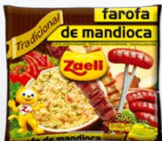
Farofa de Mandioca Tradicional Harina de Mandioca Condimentada Seasoned Cassava Flour - Traditional Flavor SAP: 101270 | 20x500g DUN 14: 1 789618390178 0 EAN 13: 7 89618390178 3 SAP: 100973 | 20x250g DUN 14: 1 789618390769 0 EAN 13: 7 89618390769 3 NCM: 1106.20.00