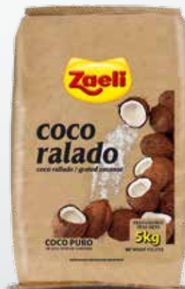
Coco Ralado 5kg Coco Rallado 5kg Grated Coconut 5kg SAP: 100305 | kg EAN 13: 7 896183 90197 4 NCM: 0801.11.00