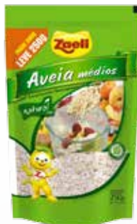
Aveia em Flocos Médios Avena en Escamas Medio Average Oat Flakes SAP: 102968 | 12x250g DUN 14: 1 7896183 91010 2 EAN 13: 7 896183 91010 5 NCM: 1104.12.00