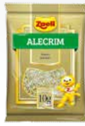
Alecrim Desidratado Alecrin Deshidratado Dried Rosemary SAP: 102587 | 20x10g DUN 14: 1 789618390926 0 EAN 13: 7 89618390926 0 NCM: 1211.90.01