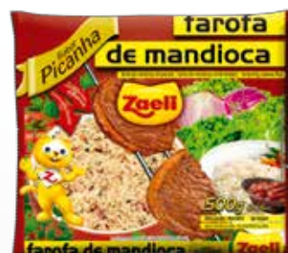
Farofa de Mandioca Picanha Harina de Mandioca Condimentada Picanha Seasoned Cassava Flour - Picanha Flavor SAP: 101271 | 20x500g DUN 14: 2 789618390551 8 EAN 13: 7 89618390551 4 NCM: 1106.20.00