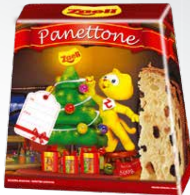
Panetone Panettone Panettone SAP: 102805 | 6x500g DUN 14: 1 789618390512 2 EAN 13: 789618390512 5 NCM: 1905.20.10